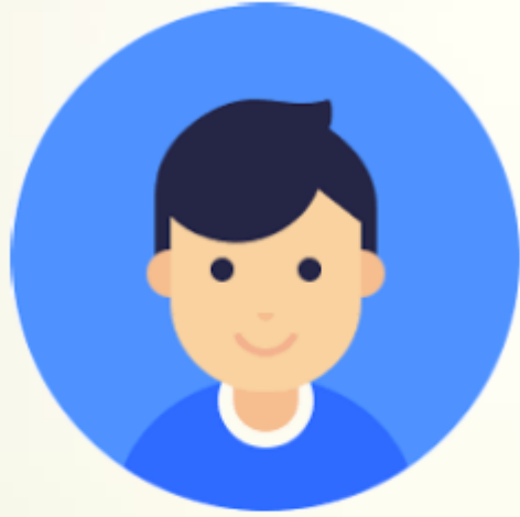
Posible usuario o cliente