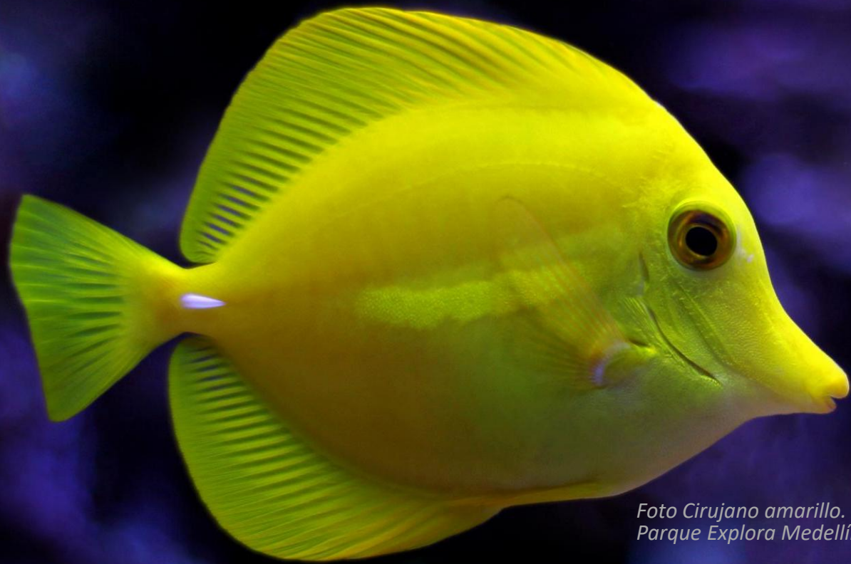
Foto Cirujano amarillo. Parque Explora Medellín

A continuación encontrarás el paso a paso para realizar tu solicitud de vinculación publicitaria.