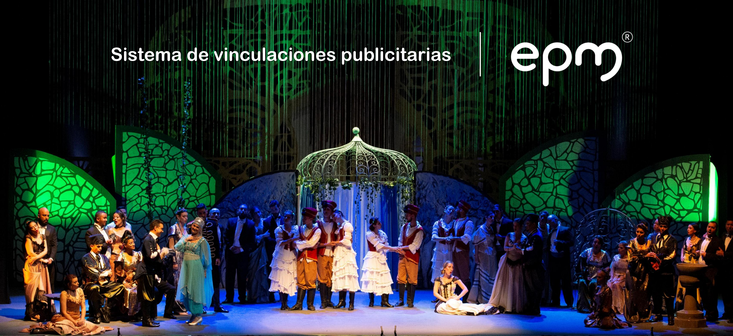
Foto Temporada de Zarzuela. Fundación Prolírica de Antioquia