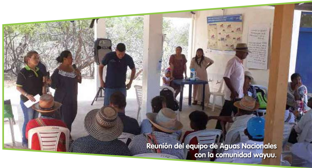
Reunión del equipo de Aguas Nacionales con la comunidad wayuu.

El Artículo 1 del Convenio 169 de la OIT, define a los pueblos indígenas como aquellos que descienden “de poblaciones que habitaban en el país o en una región geográfica a la que pertenece el país en la época de la conquista o la colonización o del establecimiento de las actuales fronteras estatales y que (...) conserven todas sus propias instituciones sociales, económicas, culturales y políticas, o parte de ellas” . “La conciencia de su identidad indígena o tribal deber considerarse un criterio fundamental para determinar los grupos a los que se aplican las disposiciones del presente Convenio” .