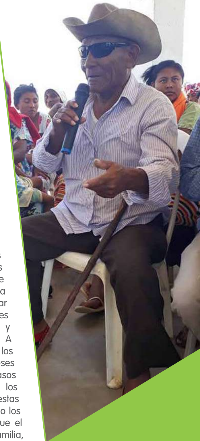
Autoridad tradicional wayuu en el municipio de Manaure (Guajira).