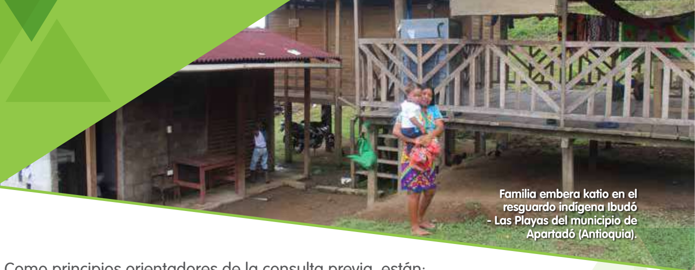
Familia embera katio en el resguardo indígena Ibudó - Las Playas del municipio de Apartadó (Antioquia).

Como principios orientadores de la consulta previa, están: