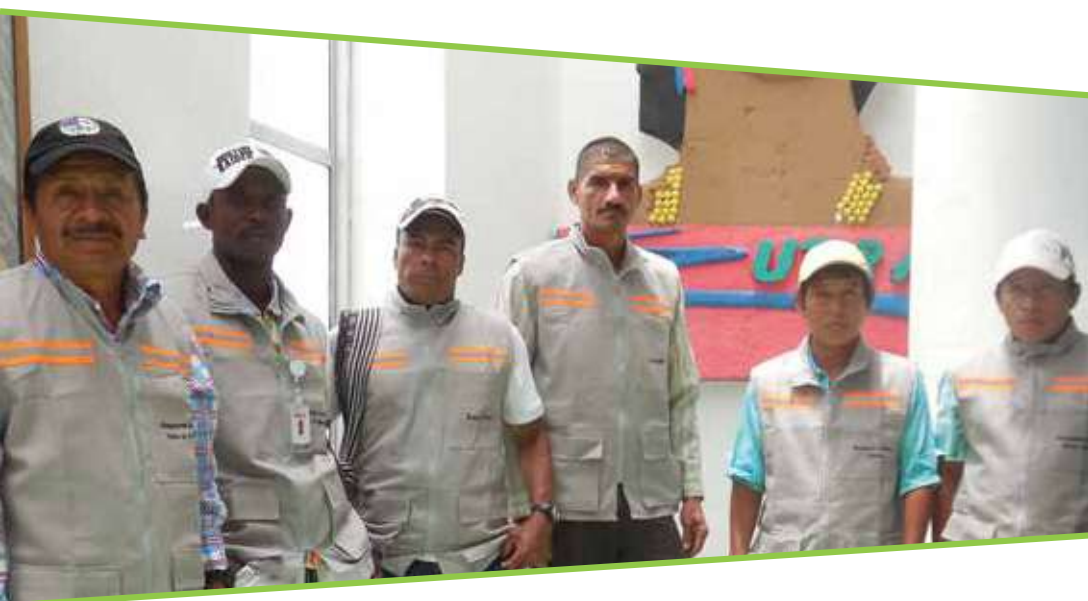
Comité interétnico Urrao.

Sus valores corporativos son la transparencia, la responsabilidad y la calidez.