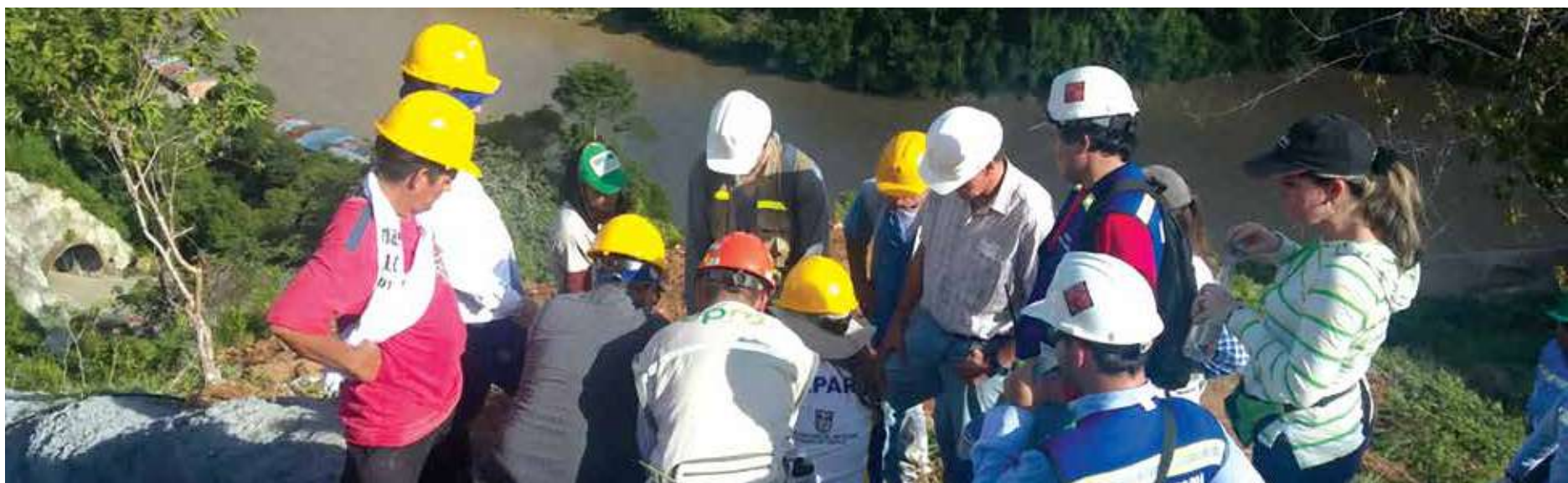
Recorrido con el DAPARD por los taludes intervenidos.

Este concepto fue emitido este mes de noviembre después de un recorrido donde el DAPARD fue acompañado por nuestros funcionarios, por la interventoría de la obra y por el contratista responsable de la construcción de la vía.