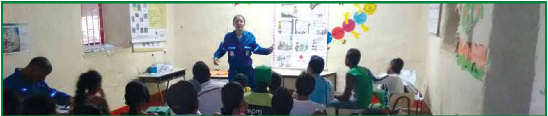
Taller de plan comunitario de emergencias: ABC plan comunitario de emergencias