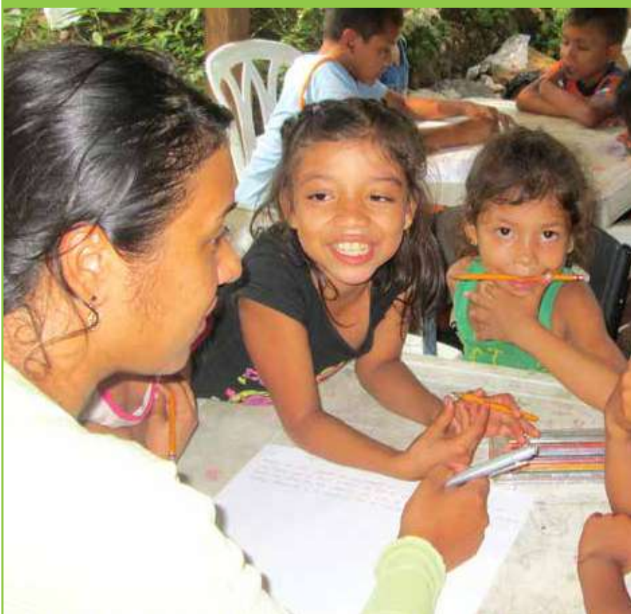
Elaboración de cuentos.

a escribir otra historia, sin olvidar con gratitud al "mono" o a "el patrón", como llaman cariñosamente al Río Cauca.