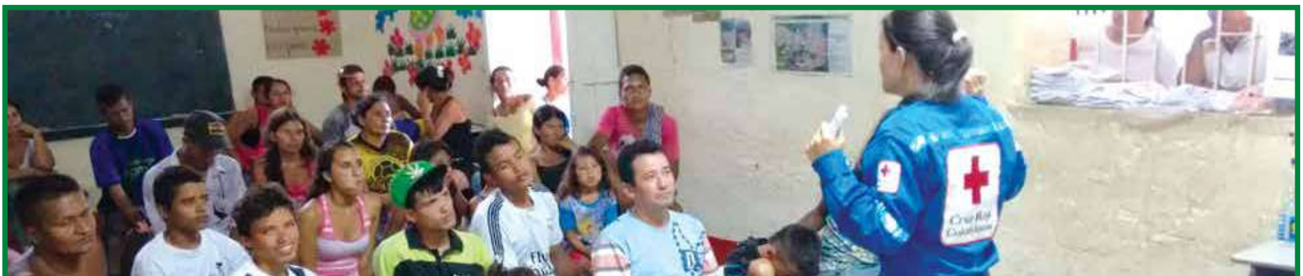
Taller de conceptos básicos en gestión del riesgo de desastres