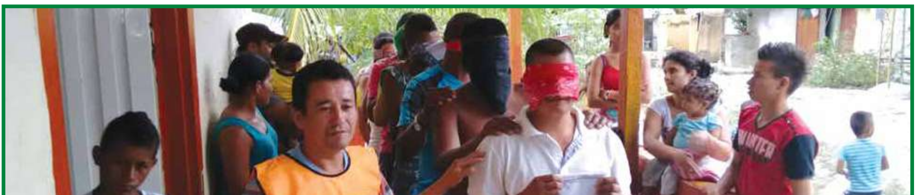
Taller de plan comunitario de emergencias Establecimiento de líderes de evacuación