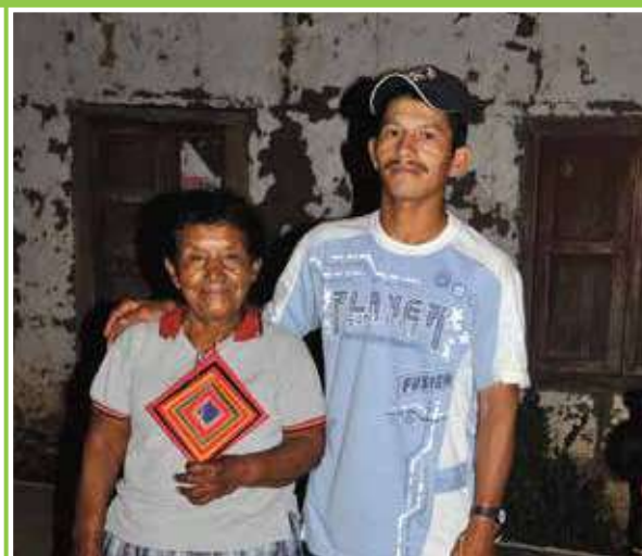
Realización de Mandalas (el arte que sana)