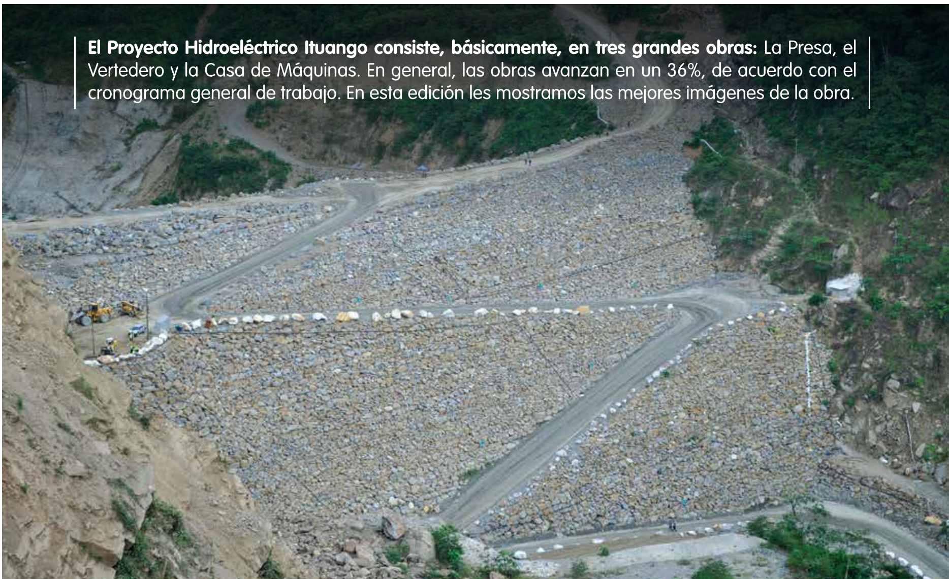
La Presa es la estructura que contendrá las aguas del río Cauca. En este momento hemos colocado más de 4 millones de metros cúbicos de roca en su construcción, lo que equivale al 22% del volumen total que tendrá la presa

El Proyecto Hidroeléctrico Ituango consiste, básicamente, en tres grandes obras: La Presa, el Vertedero y la Casa de Máquinas. En general, las obras avanzan en un 36%, de acuerdo con el cronograma general de trabajo. En esta edición les mostramos las mejores imágenes de la obra.