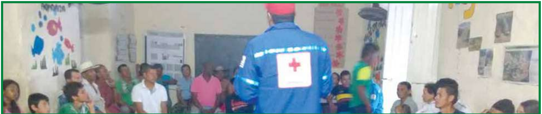
Taller Botiquín de emergencias y entrega de dotación