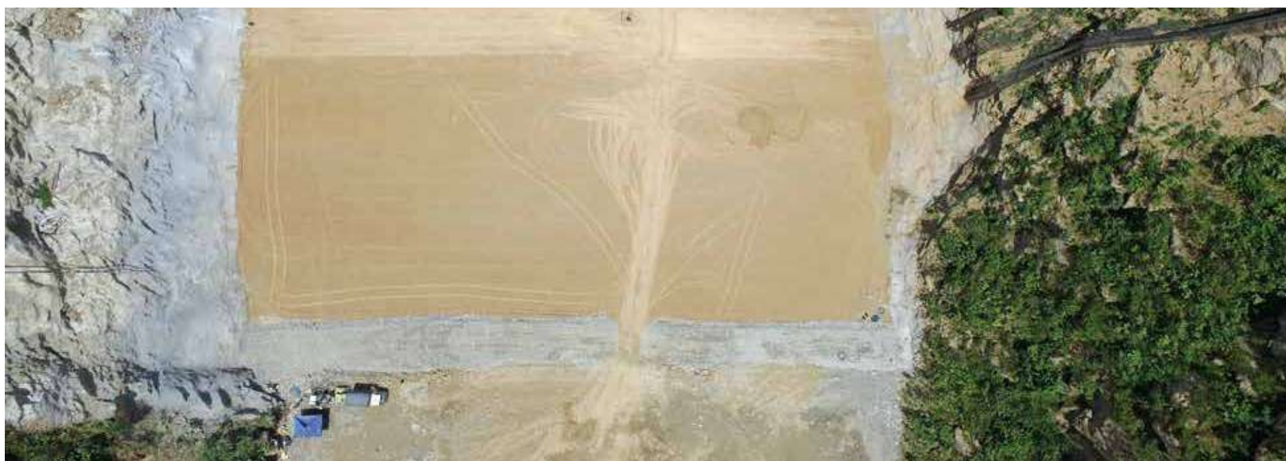
Así se ve, desde el aire, el avance núcleo impermeable de arcilla