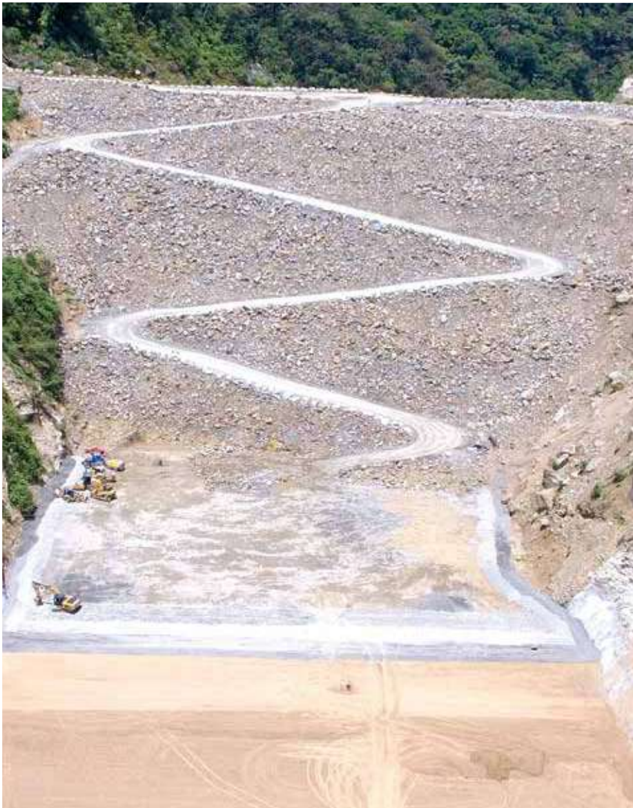
Para conseguir la impermeabilidad de la presa se avanza en el núcleo de arcilla, en el cual se han empleado unos 125 mil metros cúbicos de este material