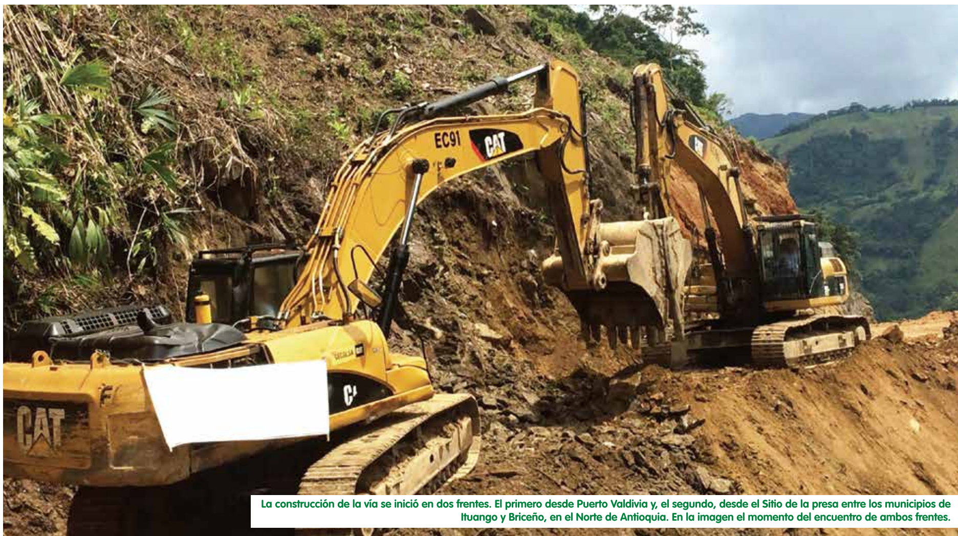
La construcción de la vía se inició en dos frentes. El primero desde Puerto Valdivia y, el segundo, desde el Sitio de la presa entre los municipios de Ituango y Briceño, en el Norte de Antioquia. En la imagen el momento del encuentro de ambos frentes.

Un importante hito se cumplió este mes en el Proyecto Hidroeléctrico Ituango: Logramos el empalme de los dos frentes de obra en el km 14 + 625, de la vía que permitirá avanzar en las excavaciones de la banca, construcción de puentes, túneles, muros y otras estructuras que faltan.