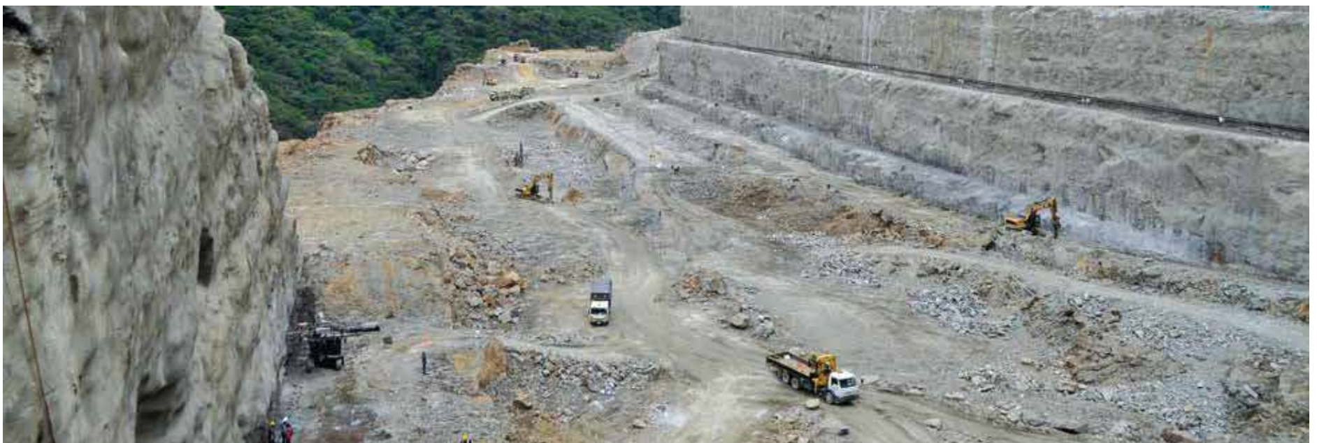
La importancia del vertedero radica en que en caso de tener una creciente, se abren las compuertas, dejando pasar el agua de forma controlada, de tal forma que las poblaciones aguas debajo de pal presa no se vean afectadas