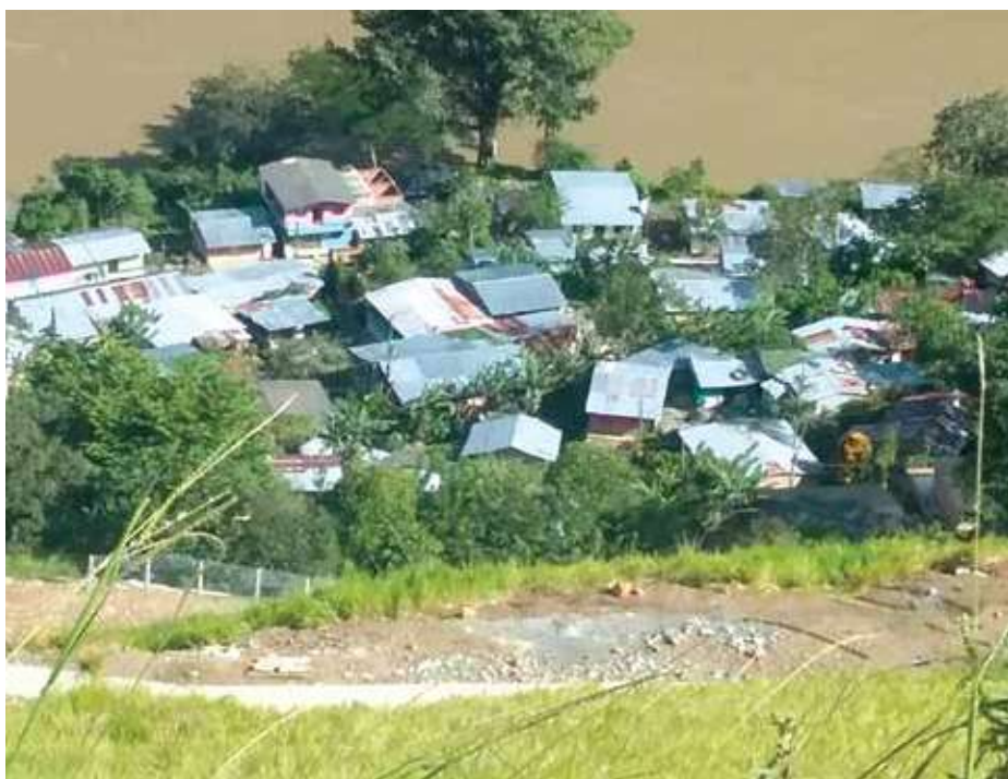
Sector Remolinos, corregimiento de Puerto Valdivia

Entre diciembre de 2104 y mayo de 2015, noventa y dos familias del sector de Remolinos –Tapias, en Puerto Valdivia, fueron trasladadas temporalmente mientras se adelantaban los trabajos de estabilización de taludes en la vía que se construye entre el corregimiento y el sitio de presa del proyecto. Hoy estas familias se están preparando para regresar a sus viviendas.