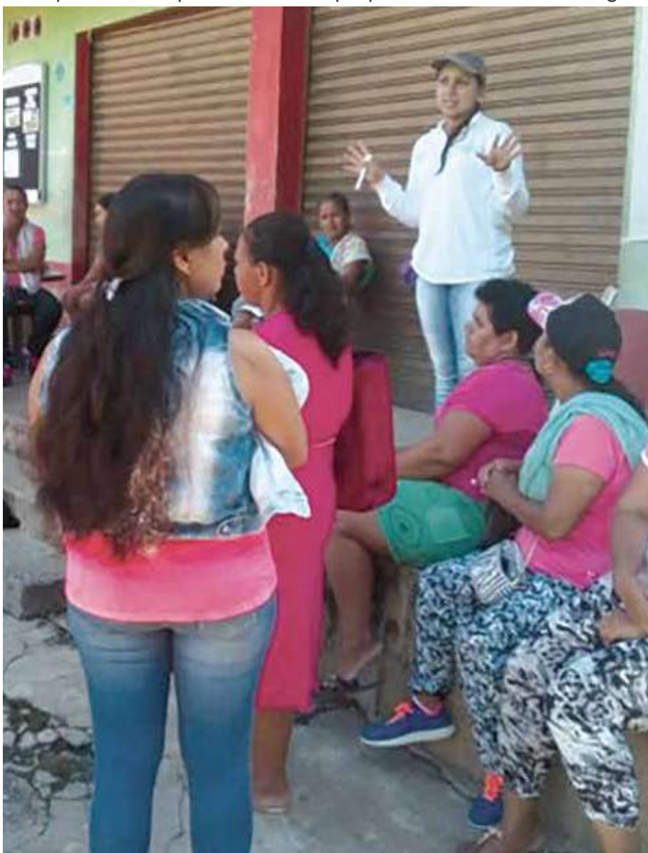
Las mujeres de Remolinos tienen un papel muy importante en este regreso. Ellas se convierten en quienes pueden movilizar a los demás integrantes de la familia para que participen de todas las actividades

Para poder contratar la construcción de las obras a realizar en Remolinos, la Junta de Acción Comunal de este sector tuvo que actualizar su documentación y para ello contaron con el acompañamiento permanente del proyecto Hidroeléctrico Ituango.