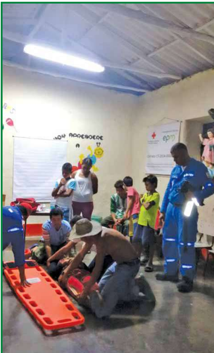
Taller de primeros auxilios comunitarios: transporte de lesionados

Seguimos fortaleciendo a las comunidades en gestión del riesgo de desastres y atención a las emergencias que se puedan presentar en los diferentes territorios del área de influencia del proyecto. Es por esto que suscribimos un contrato con la Cruz Roja para la asesoría, apoyo y capacitación para la implementación del plan de contingencia del Proyecto Hidroeléctrico Ituango.