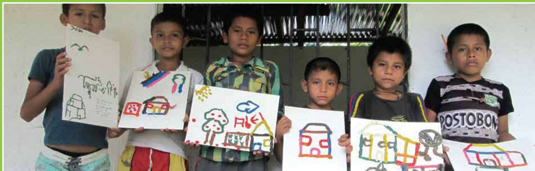
Trabajo con plastilina.