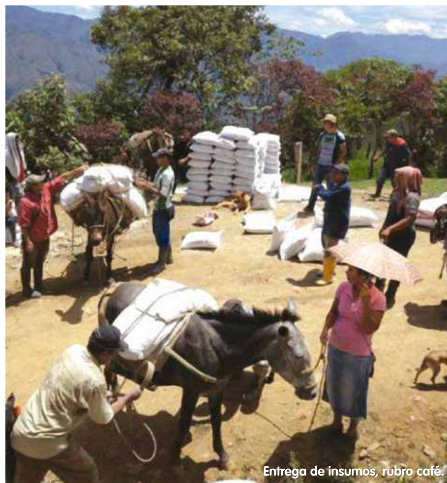
Entrega de insumos, rubro café.

4.029 familias de 164 veredas cuentan con proyectos productivos, en 1.232 hectáreas en los 6 municipios del Occidente y 12 organizaciones sociales son beneficiarias con proyectos de agricultura familiar.