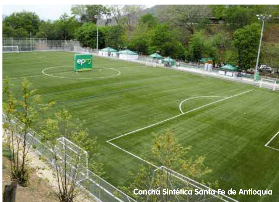
Cancha Sintética Santa Fe de Antioquia