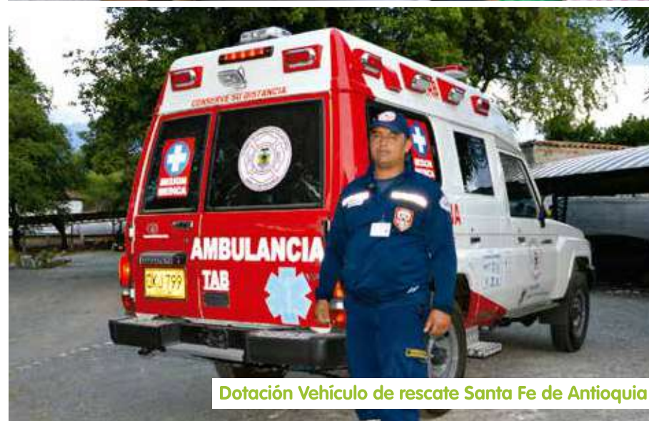
Dotación Vehículo de rescate Santa Fe de Antioquia