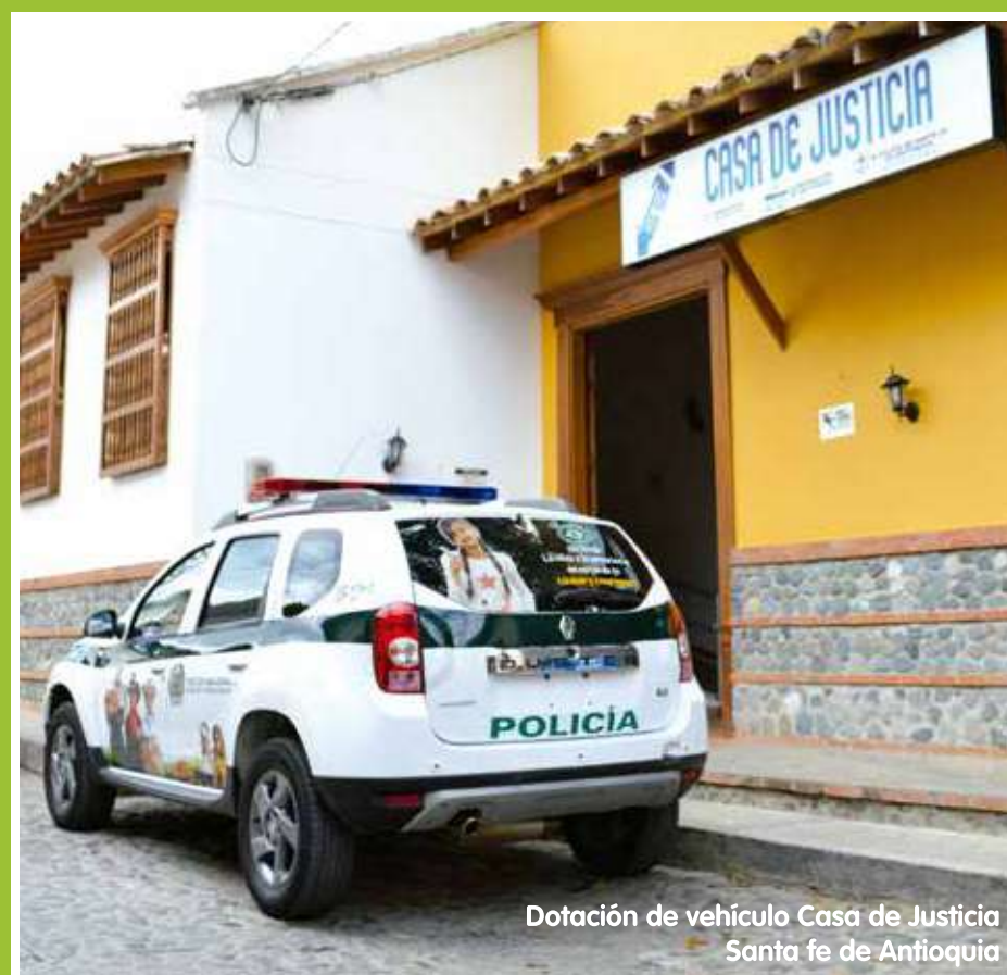
Dotación de vehículo Casa de Justicia Santa fe de Antioquia