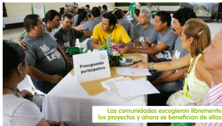
Las comunidades escogieron libremente los proyectos y ahora se benefician de ellos