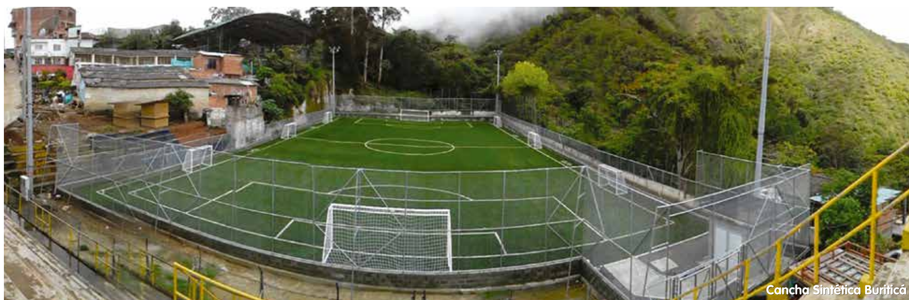
Cancha Sintética Buriticá