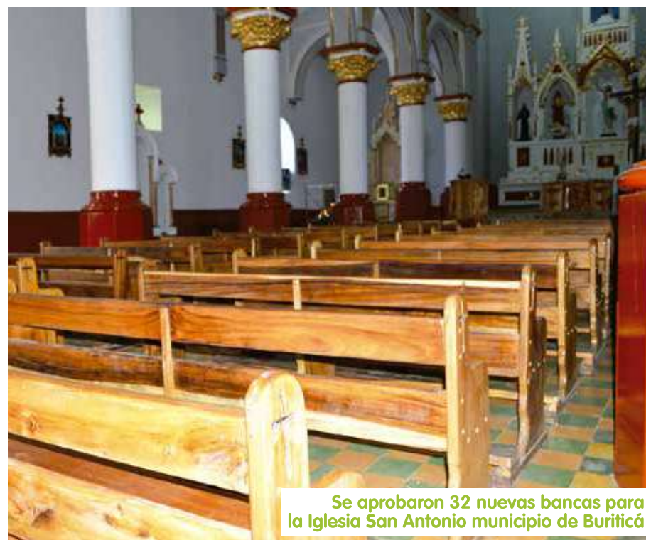
Se aprobaron 32 nuevas bancas para la Iglesia San Antonio municipio de Buriticá

Más de 17.000 personas votaron y priorizaron 70 proyectos en los 12 municipios de influencia. Hoy son sueños hechos realidad. Las comunidades los escogieron libremente y ahora disfrutan y se benefician de ellos.