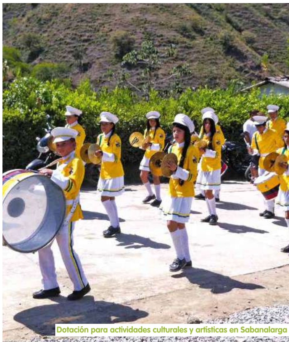
Dotación para actividades culturales y artísticas en Sabanalarga