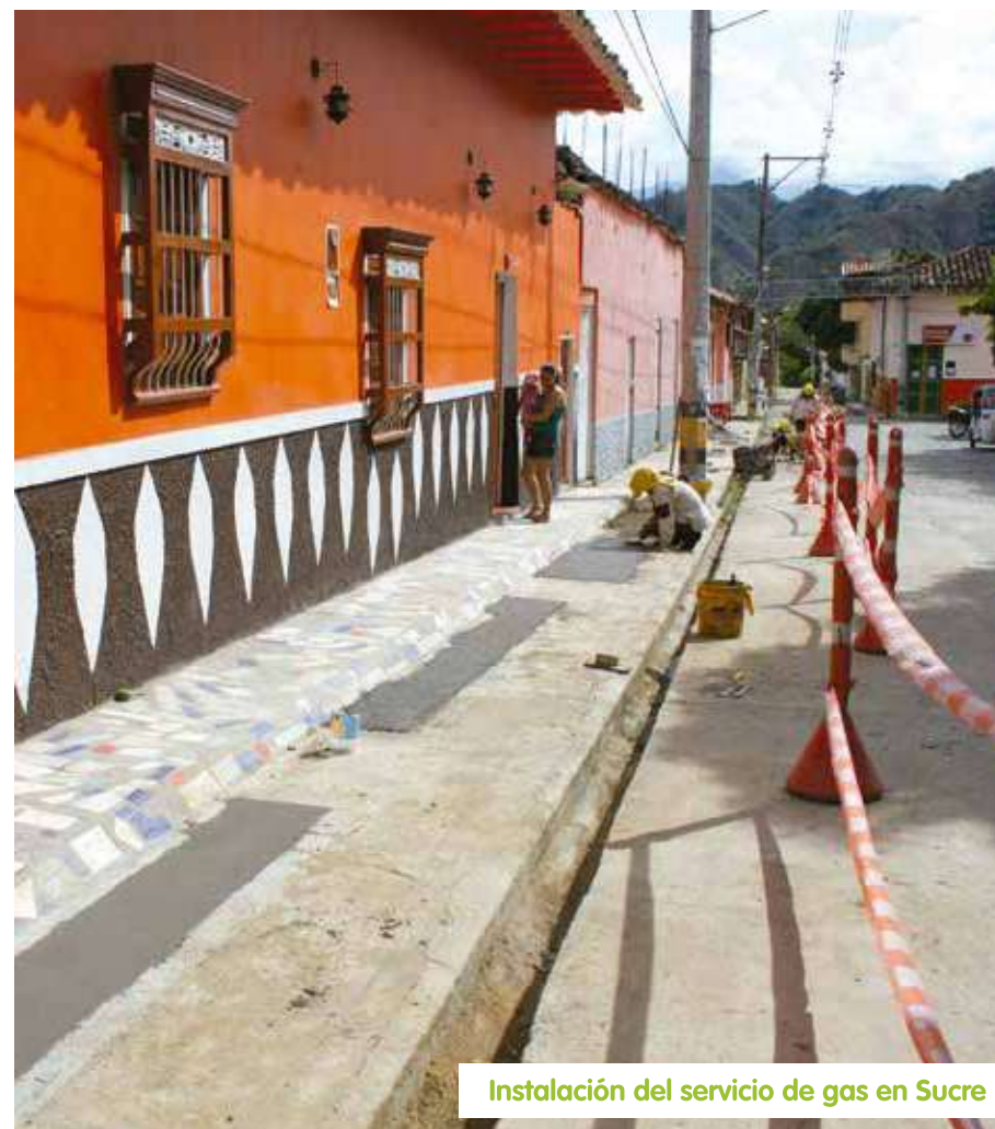
Instalación del servicio de gas en Sucre