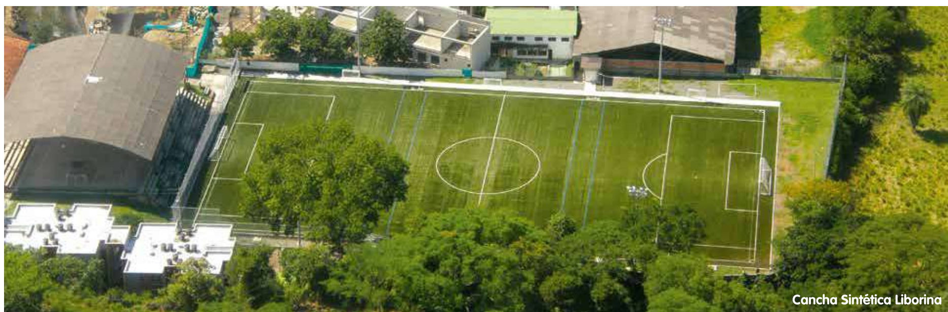
Cancha Sintética Liborina