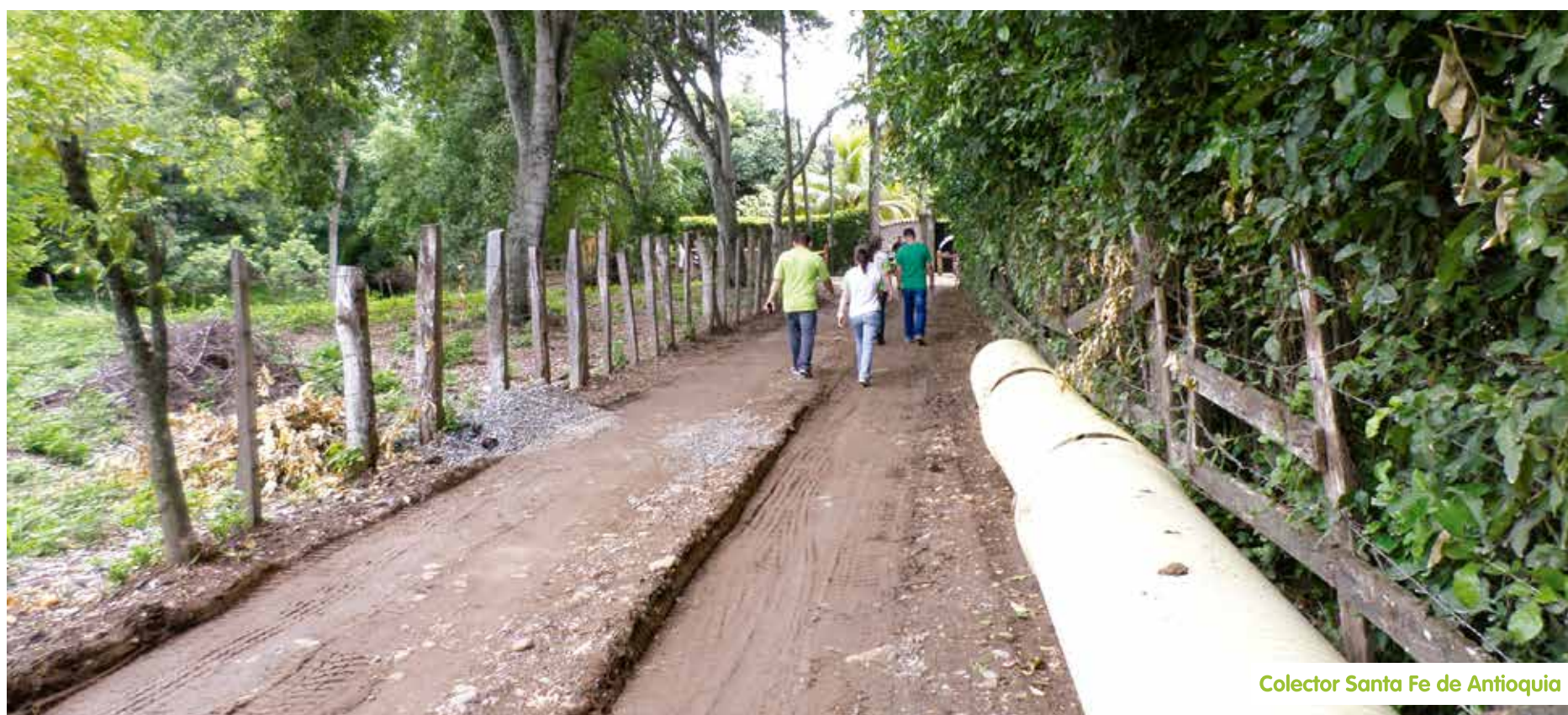
Colector Santa Fe de Antioquia