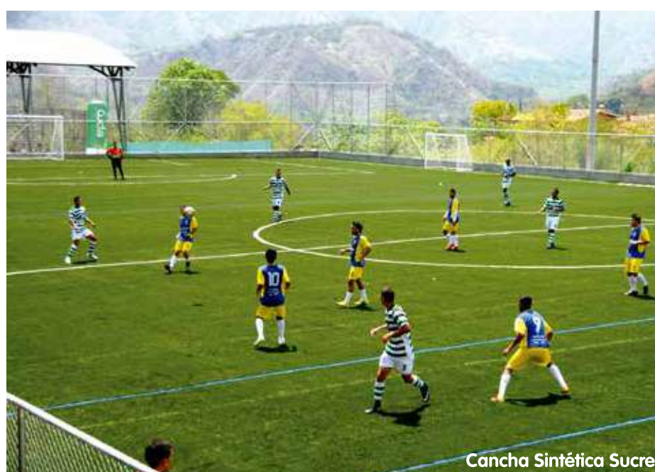
Cancha Sintética Sucre