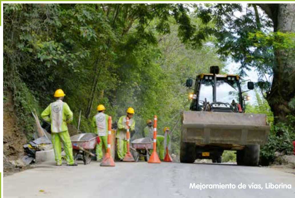
Mejoramiento de vías, Liborina