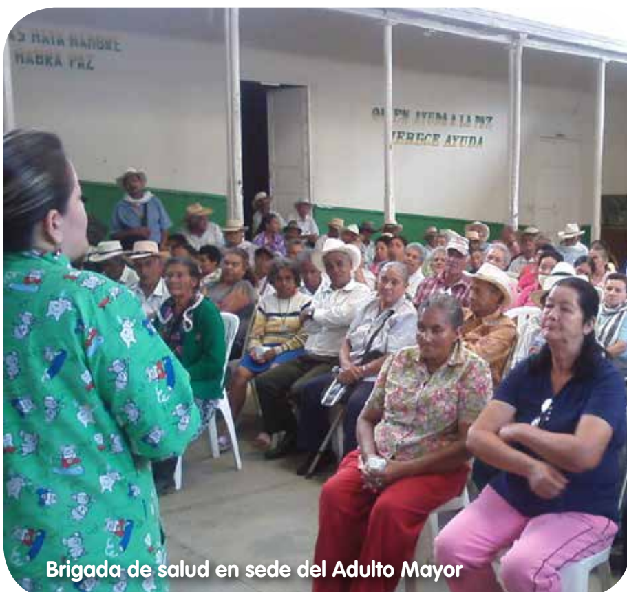
Brigada de salud en sede del Adulto Mayor

Oscar Sepúlveda Londoño, Alcalde de San Andrés de Cuerquia