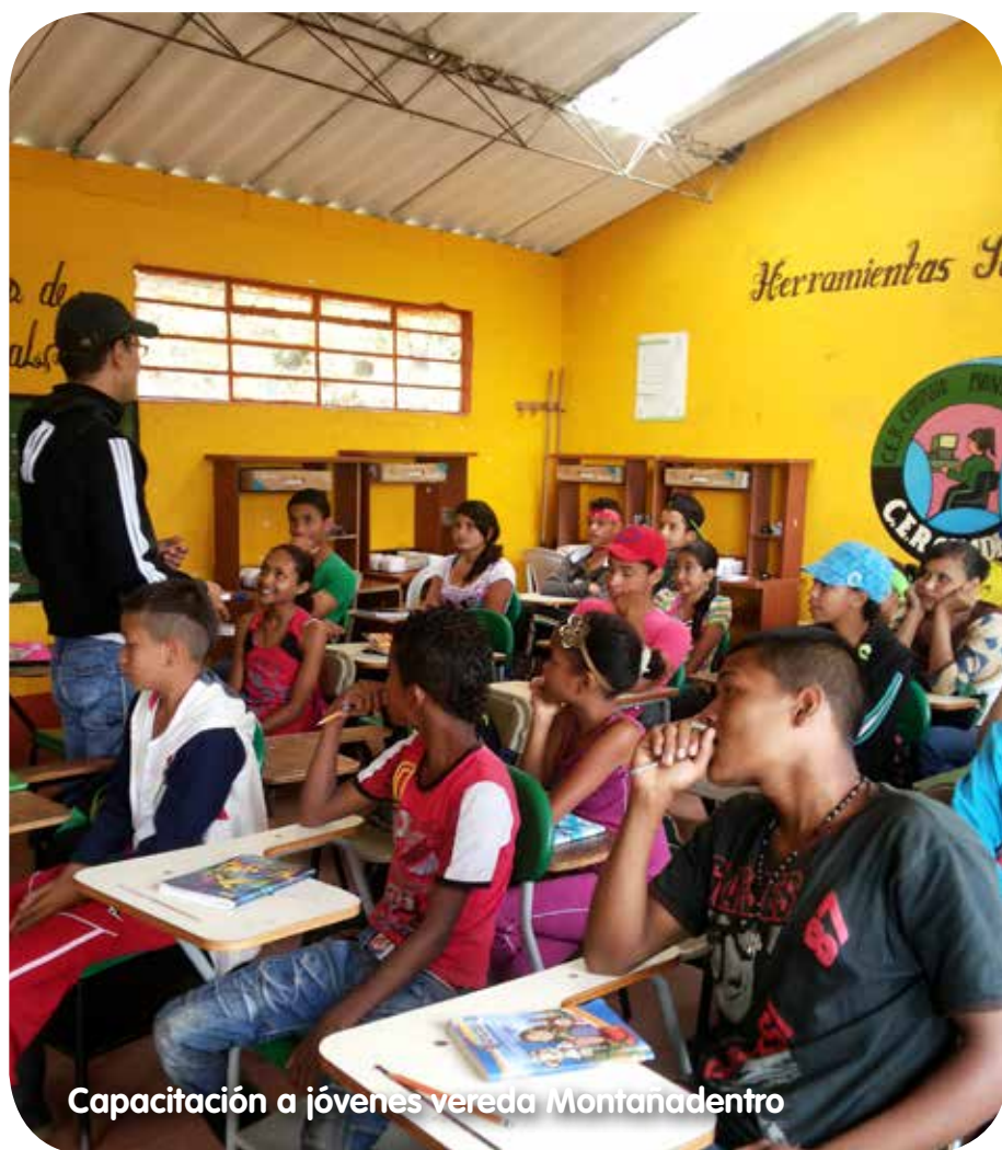
Capacitación a jóvenes vereda Montañadentro

El proceso de Telemedicina se realiza luego de que un médico general evalúa a un paciente y con los resultados de sus exámenes, el médico se los transmite a un equipo de especialistas, que desde su consultorio rápidamente le da la respuesta a su consulta, indicándole los procedimientos a emprender y el tratamiento a implementar, evitándole al paciente un traslado desde su municipio hasta un hospital de mayor complejidad. Con esto, la comunidad no tiene que incurrir en gastos de transporte y ni de estadía en otro municipio.