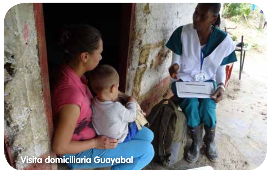
Visita domiciliaria Guayabal

Además de las visitas domiciliarias también se realizan jornadas de educación a la comunidad, según las necesidades que se van detectando en las visitas. Adicionalmente, se programan brigadas de salud con personal médico, odontológico, nutricionista, y promotores de vida y salud, para brindar una atención integral a las comunidades rurales.