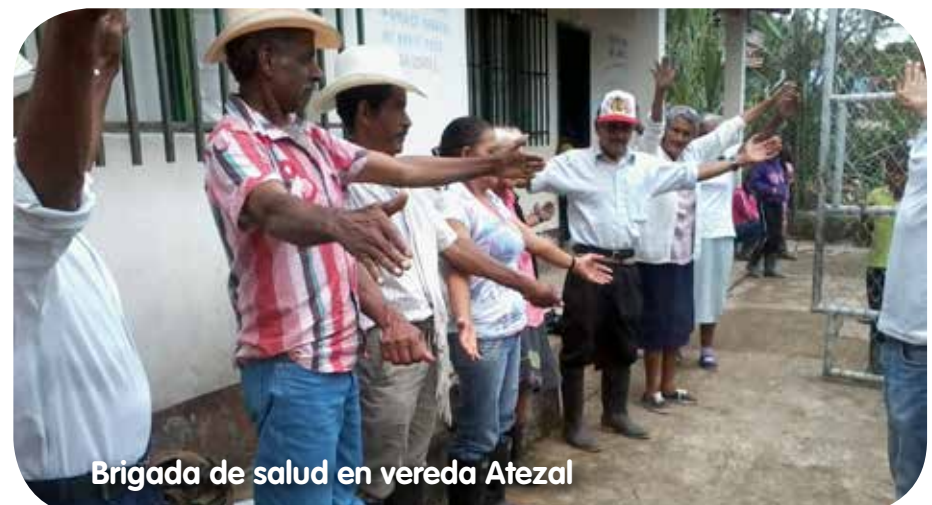
Brigada de salud en vereda Atezal