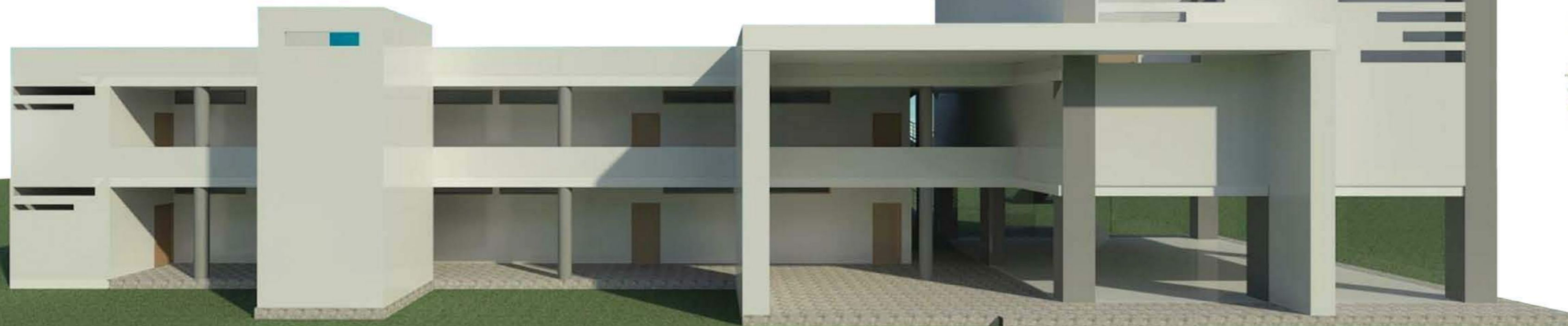
Centro Educativo Rural Vista Frontal

Una placa polideportiva con dimensiones mínimas reglamentarias será ubicada en el lote que ocupa actualmente "la bloquera". Este espacio deportivo contará con graderías y cubierta en teja termo acústica, así como obras de adecuación urbanística, jardines y prados.