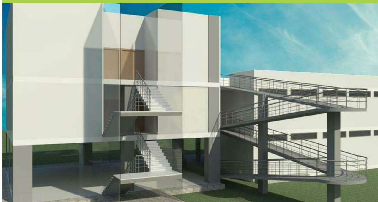
Centro Educativo Rural Vista Lateral

En el lote de la escuela actual, se construirá un nuevo edificio de 1.200 metros cuadrados, en dos niveles. Allí se prestarán servicios educativos para 140 alumnos y funcionarán el área administrativa, una biblioteca, un aula múltiple, 5 aulas de clase, un laboratorio, el restaurante escolar y la vivienda de profesores.