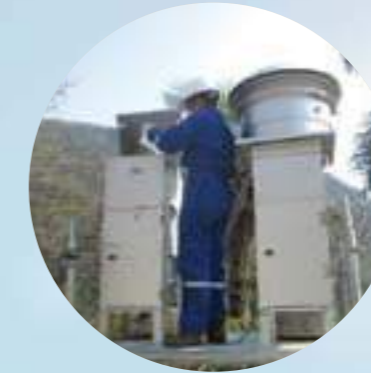
Los monitoreos de la calidad del aire tienen una duración de 18 días continuos.

del mismo municipio y en el corregimiento El Valle del municipio de Toledo, que son los lugares del área de influencia directa en donde se encuentra concentrada la mayor parte de las comunidades.