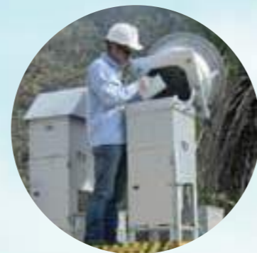
Los operarios cambian todos los días los filtros que retienen el material particulado en el aire y después se llevan al laboratorio para analizar las muestras de terminar su concentración.