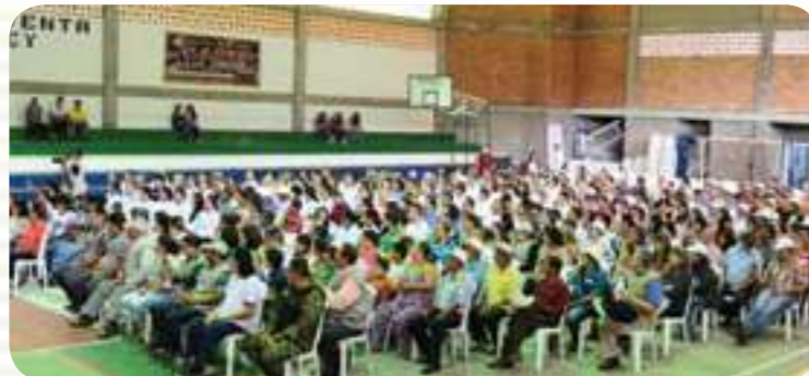
Masiva asistencia de todas las fuerzas vivas del municipio al evento de firma del convenio que representa un salto importante hacia un mejor futuro.