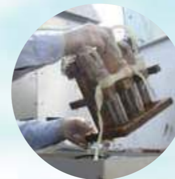
Estos son otros equipos que retienen los gases de la atmósfera dentro una muestra líquida para después analizarlas en el laboratorio y determinar la concentración de gases en el aire.

Las mediciones son realizadas por la Unión Temporal conformada por la consultora Conintegral y la Universidad de Medellín, la cual se encarga de hacer la toma de muestras y los respectivos análisis de laboratorio que cuentan con las acreditaciones del Ideam. Una vez obtenidos estos resultados, se comparan con la normatividad ambiental y se determina el Índice de Calidad del Aire –ICA- que para todos los parámetros y sitios mencionados es catalogada actualmente como dentro de los límites exigidos.