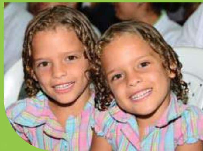
Niños y adultos estuvieron muy atentos a la información que sólo traía buenas noticias para san Andrés de Cuerquia.