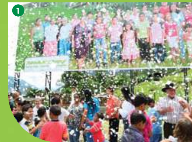
1 Con la instalación de la valla que señala el sitio donde quedarán sus nuevos hogares, las 16 familias de jardines de San Andrés celebraron el inicio de una nueva vida, en medio de una lluvia de confeti blanco.