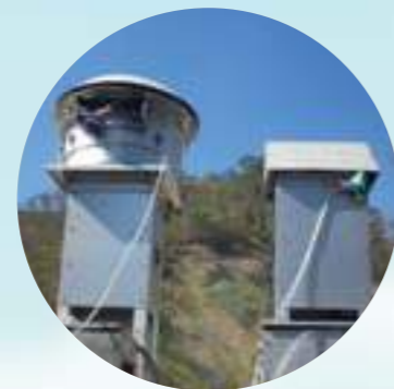
Estos aparatos se llaman "hi-vol", o equipos de alto volumen, y son los que miden la cantidad de material particulado en el aire.

El objetivo de estos monitoreos es evaluar la calidad del aire en el casco urbano del municipio de San Andrés de Cuerquia, en la vereda Alto Seco