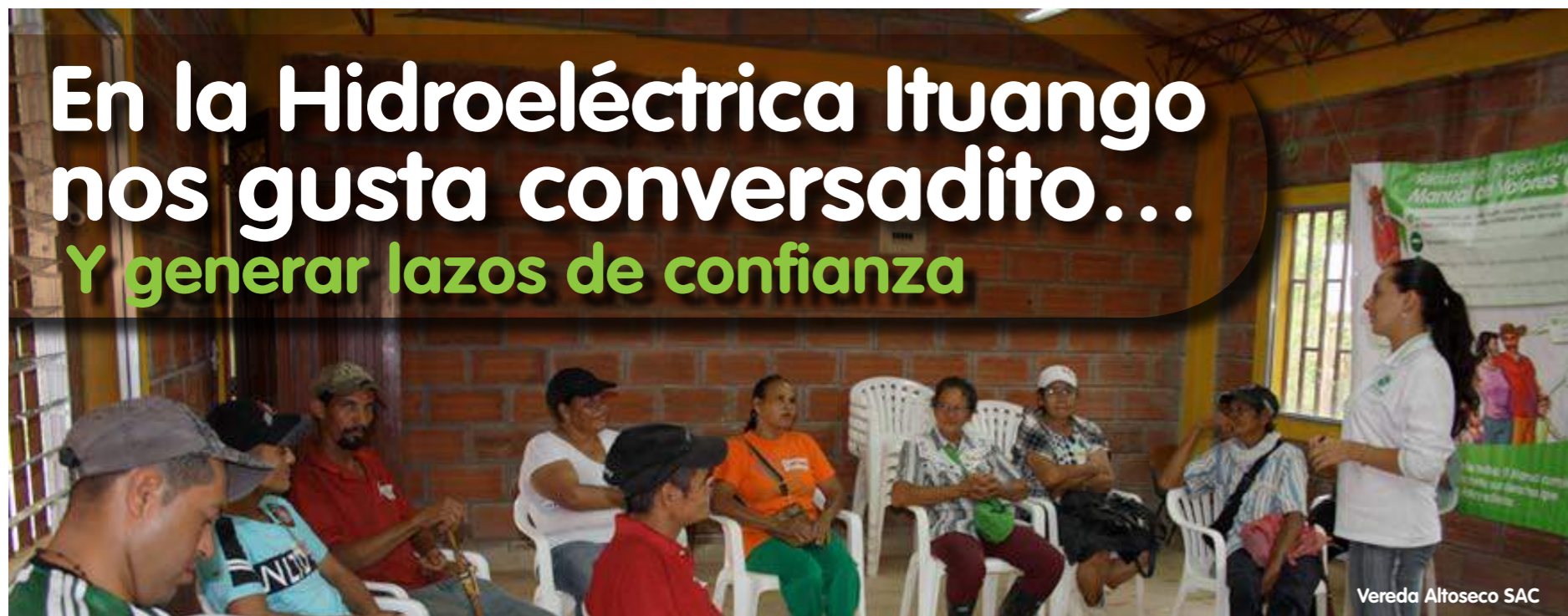
Vereda Altoseco SAC