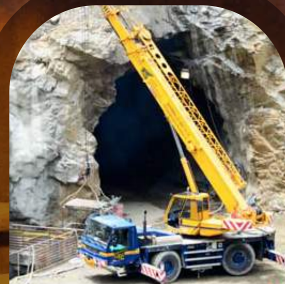
Excavaciones pozos de compuertas

Así se ven actualmente las obras más importantes del proyecto: