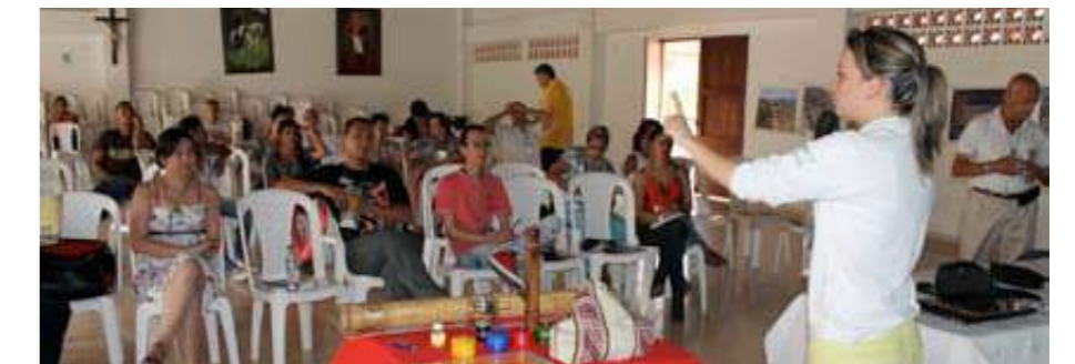
El Foro permitió compartir experiencias pedagógicas novedosas como los colectivos de comunicación.