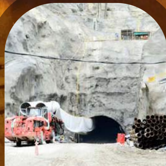
Portal de salida del túnel de desviación derecho