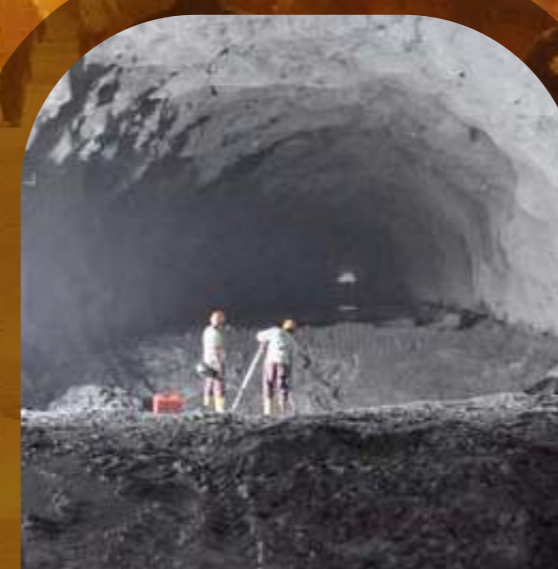
Túnel desviación derecho