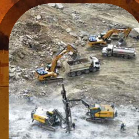
Excavaciones del vertedero