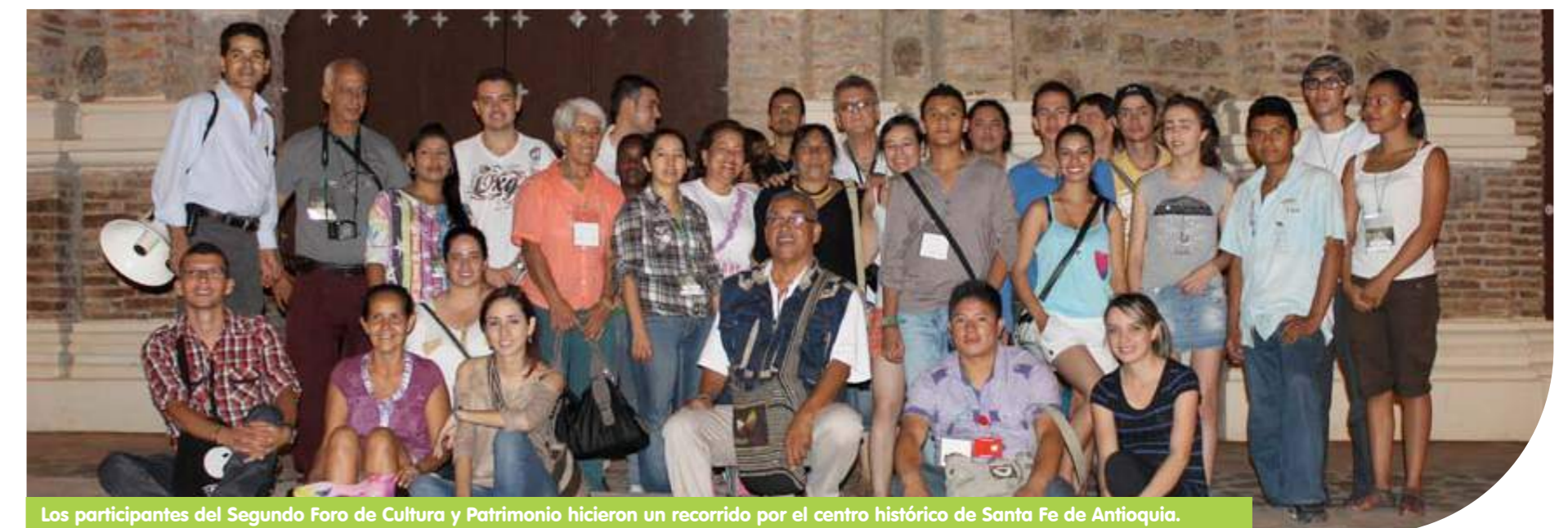
Los participantes del Segundo Foro de Cultura y Patrimonio hicieron un recorrido por el centro histórico de Santa Fe de Antioquia.