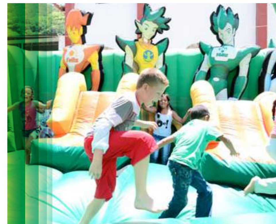
Para los niños se instalaron carpas con pintacaritas, concurso de dibujo y un inflable para que la diversión no tuviera límites.