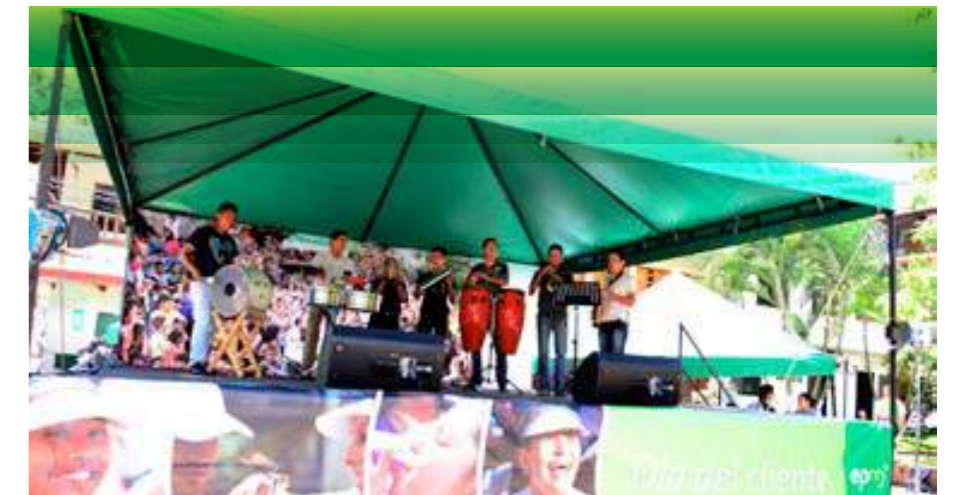
En la tarima principal se presentaron los grupos artísticos y culturales de la casa de la cultura de Peque: Danza, teatro, música, que amenizaron el evento toda la tarde.

El tema central no podía faltar: El Plan integral Hidroeléctrica Ituango como oportunidad para impulsar positivamente el desarrollo de Peque.