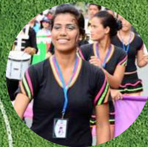
La banda músico-marcial de Tarazá acompañó a las delegaciones en la apertura del torneo.