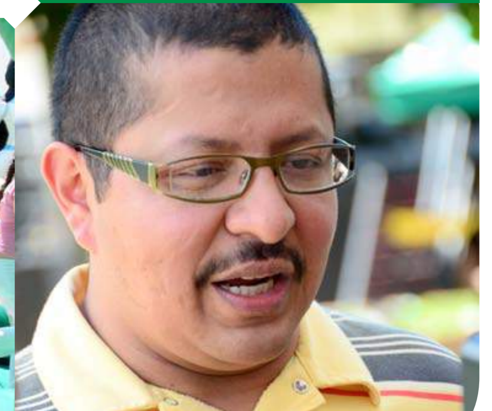
El alcalde de Peque, Hugo León Girón Graciano, acompañó con entusiasmo las actividades de la jornada.