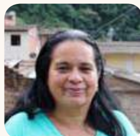
Familias de San Andrés de Cuerquia:

“Fue una experiencia maravillosa y es el momento para dar los agradecimientos a EPM, una experiencia