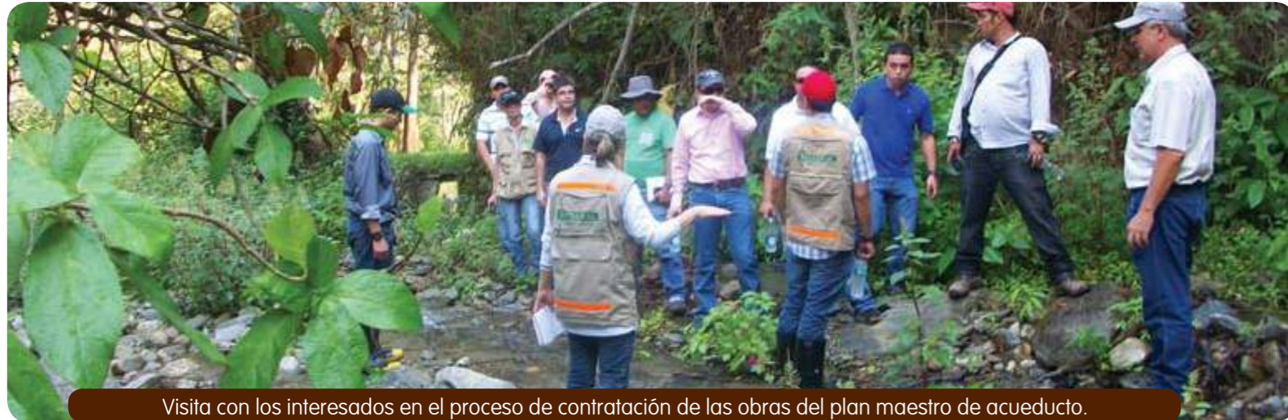
Visita con los interesados en el proceso de contratación de las obras del plan maestro de acueducto.