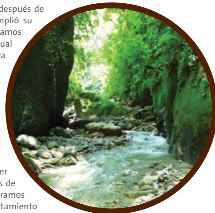
Sitio de la captación propuesto sobre la quebrada La Uriaga.

De acuerdo con el cronograma del proceso de contratación, esperamos poder adjudicar el contrato a mediados del mes de abril. Ya recibimos las propuestas de nueve firmas interesadas en la ejecución de los trabajos. Con esta labor, esperamos poder brindar agua potable de excelente calidad y saneamiento básico (con tratamiento de aguas residuales) a la totalidad de la población del Corregimiento El Valle de Toledo. Una vez concluyan las obras, entregaremos el sistema a la Junta de Acción Comunal del Corregimiento para que lo maneje y lo administre.