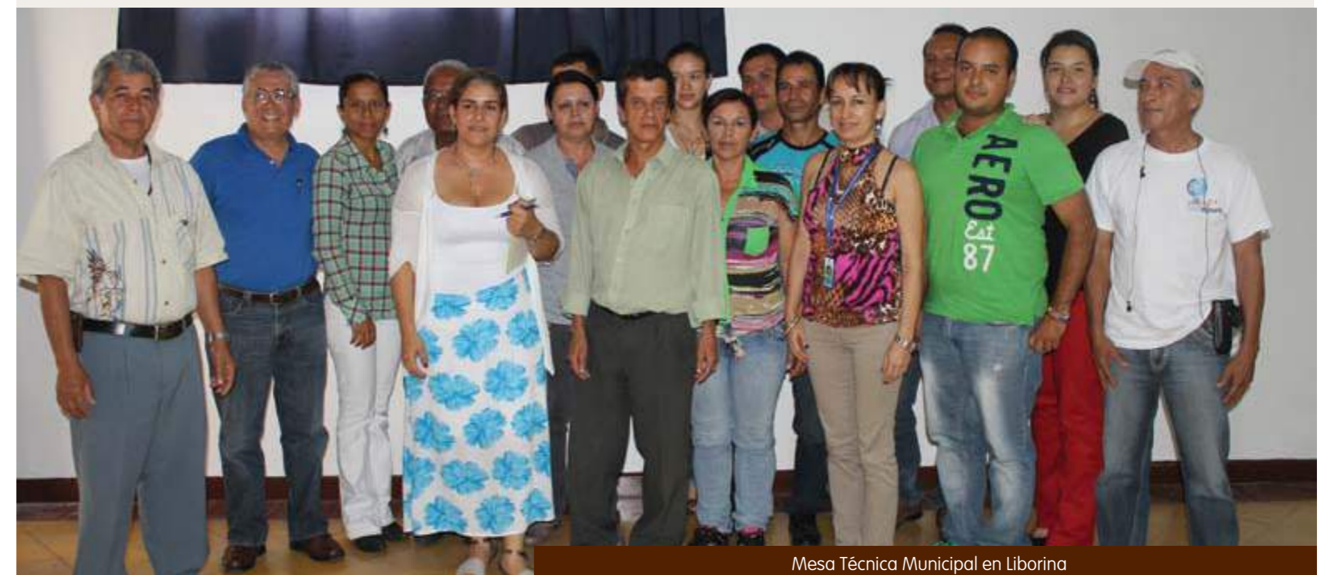
Mesa Técnica Municipal en Liborina

Durante el mes de abril los funcionarios de la Gobernación de Antioquia y de EPM, responsables de cada línea ajustarán en detalle los proyectos. Con este insumo se instalarán los comités de trabajo para validar los proyectos con los delegados de las administraciones, de la Gobernación y de EPM, de tal manera que durante lo que quede del año 2013 y 2014 se implementen y terminen los proyectos, cumpliendo con los objetivos de desarrollo propuestos. Esperamos al finalizar este año hacer una asamblea regional de cuentas claras que nos permita con transparencia informar, a toda la sociedad, de los avances de la inversión.