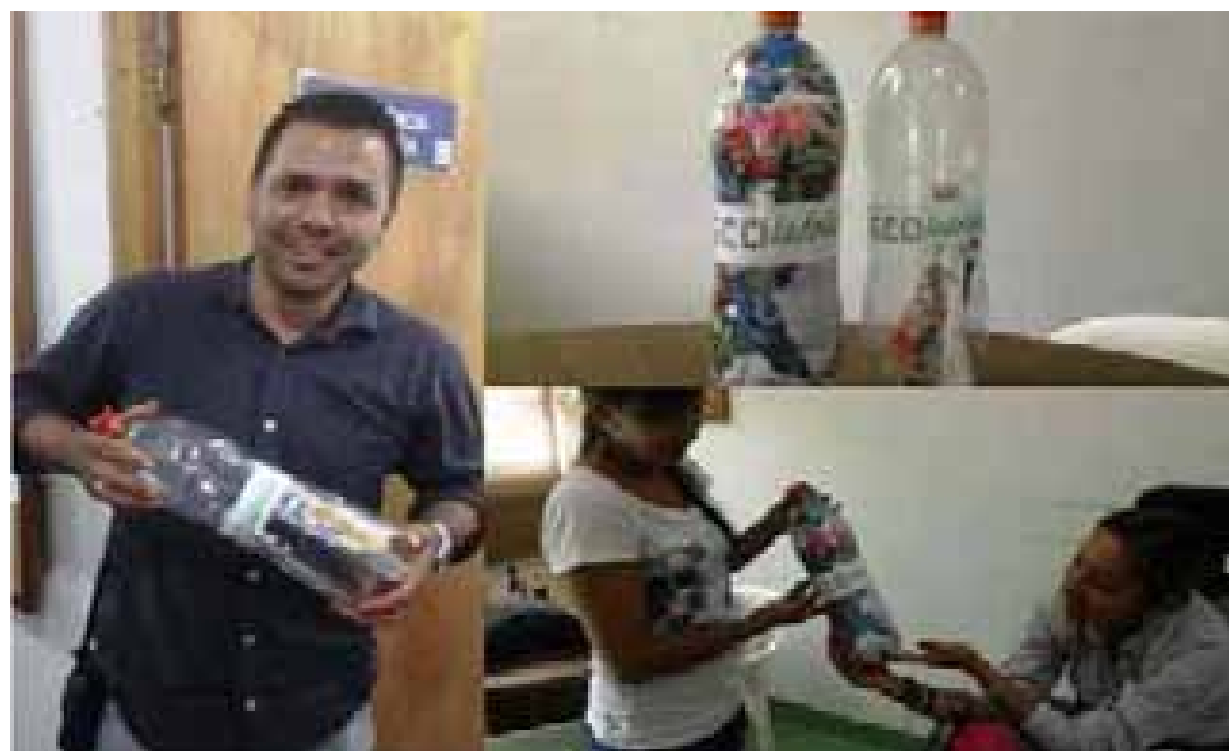
Elaboración de ladrillos ecológicos

Algunos de los residuos peligrosos que genera el proyecto son: estopas y aceites usados, lámparas fluorescentes, baterías, residuos de pintura y cartuchos de impresora, entre otros. Cuando los contratistas generan residuos peligrosos tienen la obligación de manejarlos de acuerdo con sus características de peligrosidad. Para ello se construyen puntos de almacenamiento con unas características técnicas que aseguran su correcto almacenamiento, y posteriormente se contratan gestores externos o empresas con licencia ambiental para realizar el aprovechamiento o eliminación de los residuos peligrosos. En nuestra próxima edición les contaremos qué más estamos haciendo para proteger el ambiente, que es nuestra prioridad.