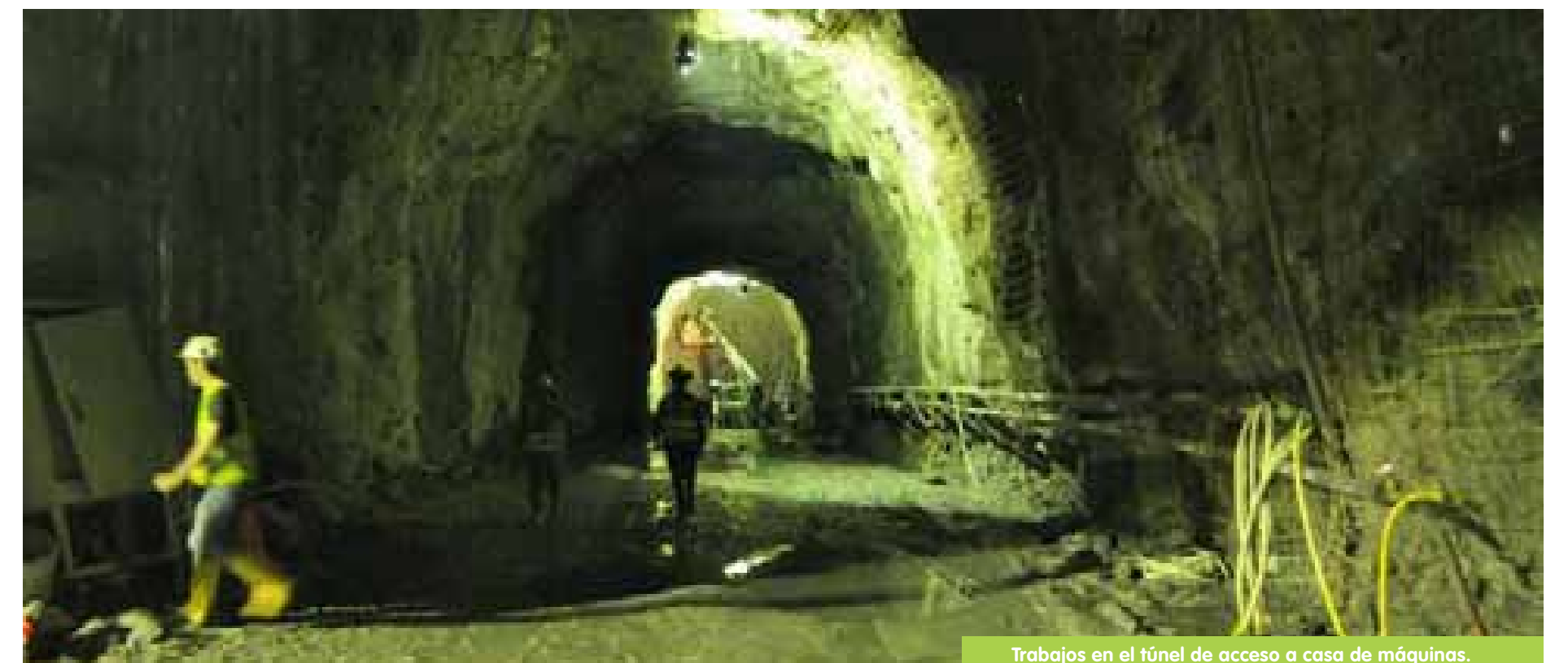
Trabajos en el túnel de acceso a casa de máquinas.

www.epm.com.co/site/home/institucional/nuestrosproyectos/ituango.aspx