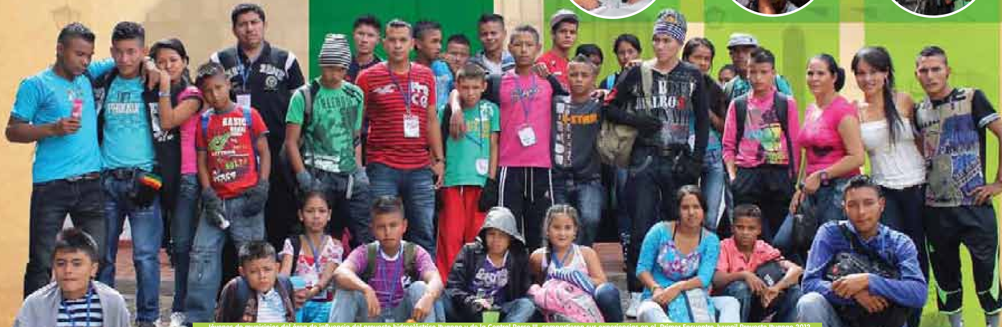
Jóvenes de municipios del área de influencia del proyecto hidroeléctrico Ituango y de la Central Porce III, compartieron sus experiencias en el Primer Encuentro Juvenil Proyecto Ituango 2012.