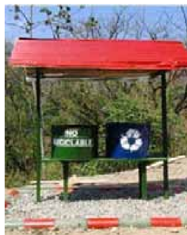
Separación en la fuente - puntos ecológicos