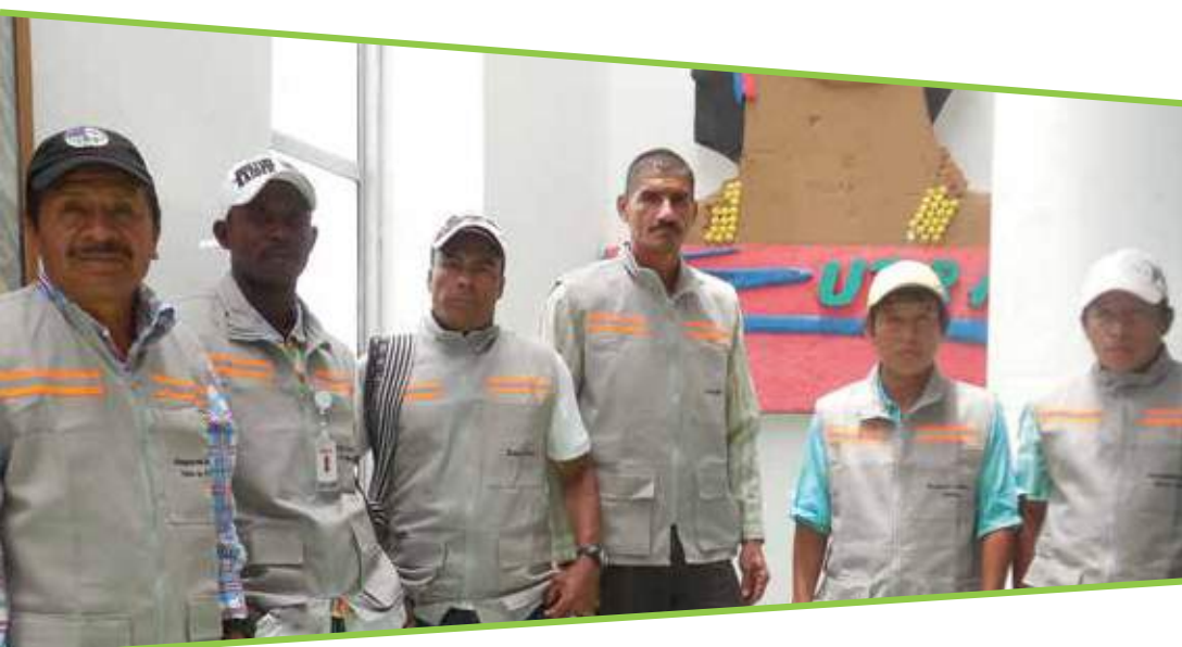
Comité interétnico Urrao.

Sus valores corporativos son la transparencia, la responsabilidad y la calidez.