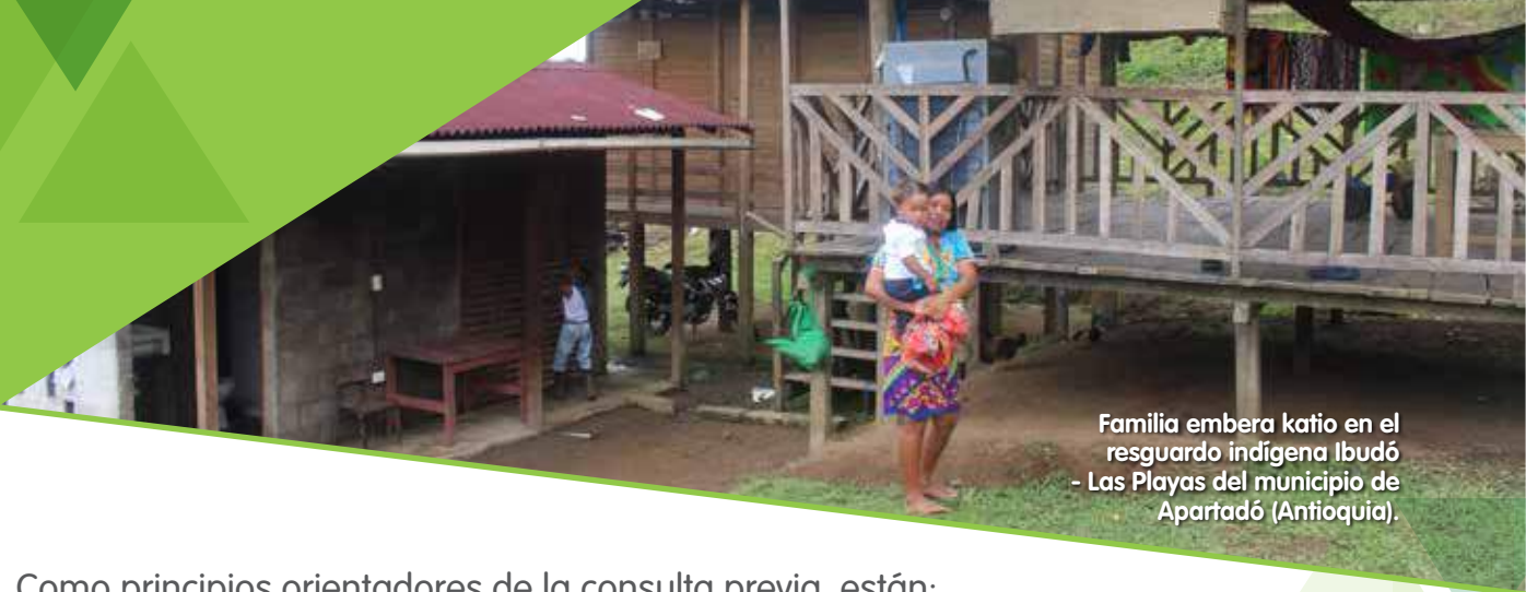
Familia embera katio en el resguardo indígena Ibudó - Las Playas del municipio de Apartadó (Antioquia).

Como principios orientadores de la consulta previa, están: