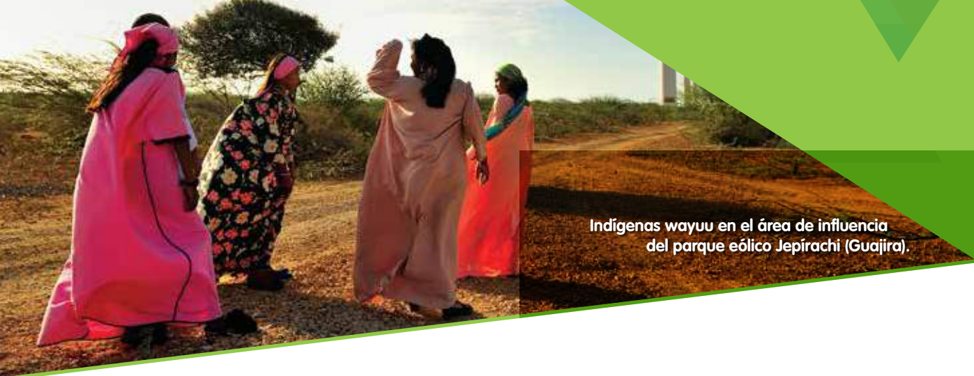
Indígenas wayuu en el área de influencia del parque eólico Jepirachi (Guajira).