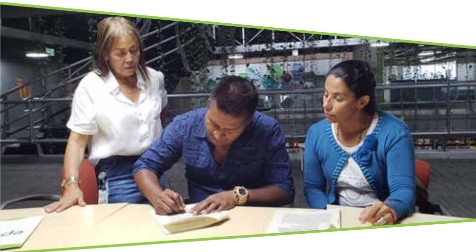
Firma de acuerdos con representantes de la comunidad nutabe en Itango (Antioquia).