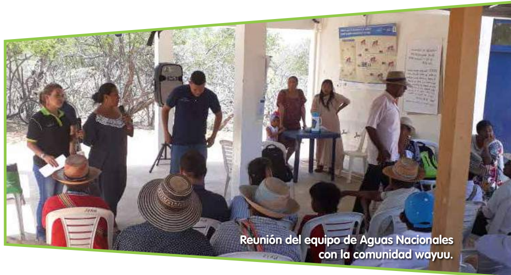
Reunión del equipo de Aguas Nacionales con la comunidad wayuu.

El Artículo 1 del Convenio 169 de la OIT, define a los pueblos indígenas como aquellos que descienden “de poblaciones que habitaban en el país o en una región geográfica a la que pertenece el país en la época de la conquista o la colonización o del establecimiento de las actuales fronteras estatales y que (...) conserven todas sus propias instituciones sociales, económicas, culturales y políticas, o parte de ellas” . “La conciencia de su identidad indígena o tribal deberá considerarse un criterio fundamental para determinar los grupos a los que se aplican las disposiciones del presente Convenio” .