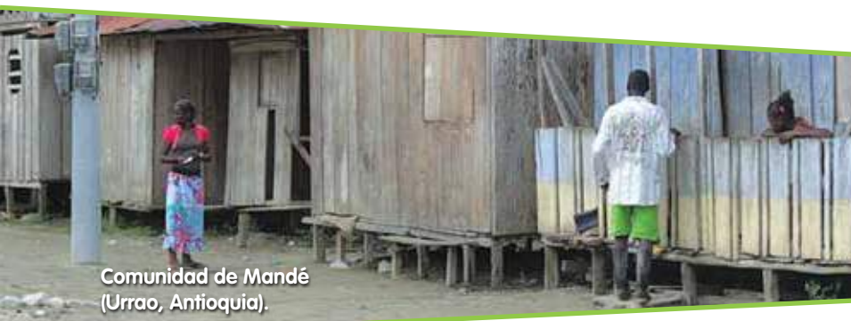
Comunidad de Mandé (Urao, Antioquia).

La Organización de las Naciones Unidas para la Educación, la Ciencia y la Cultura, Unesco, a partir de la ruta del esclavo y la historia general de África, y a partir de las consultas organizadas por el Alto Comisionado de Naciones Unidas para los Derechos Humanos, ha promovido una estrategia integrada de lucha contra el racismo, la discriminación, la xenofobia y la intolerancia.