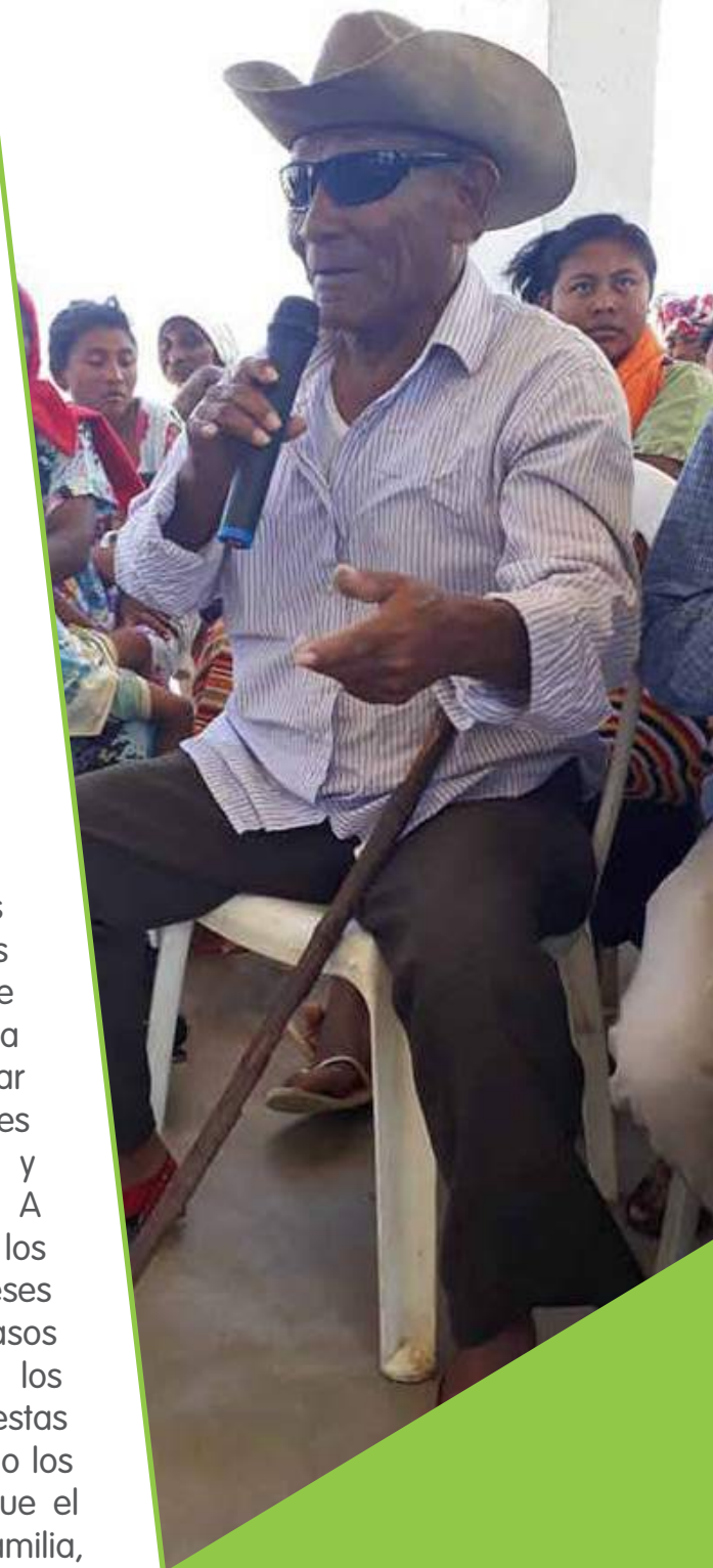
Autoridad tradicional wayuu en el municipio de Manaure (Guajira).