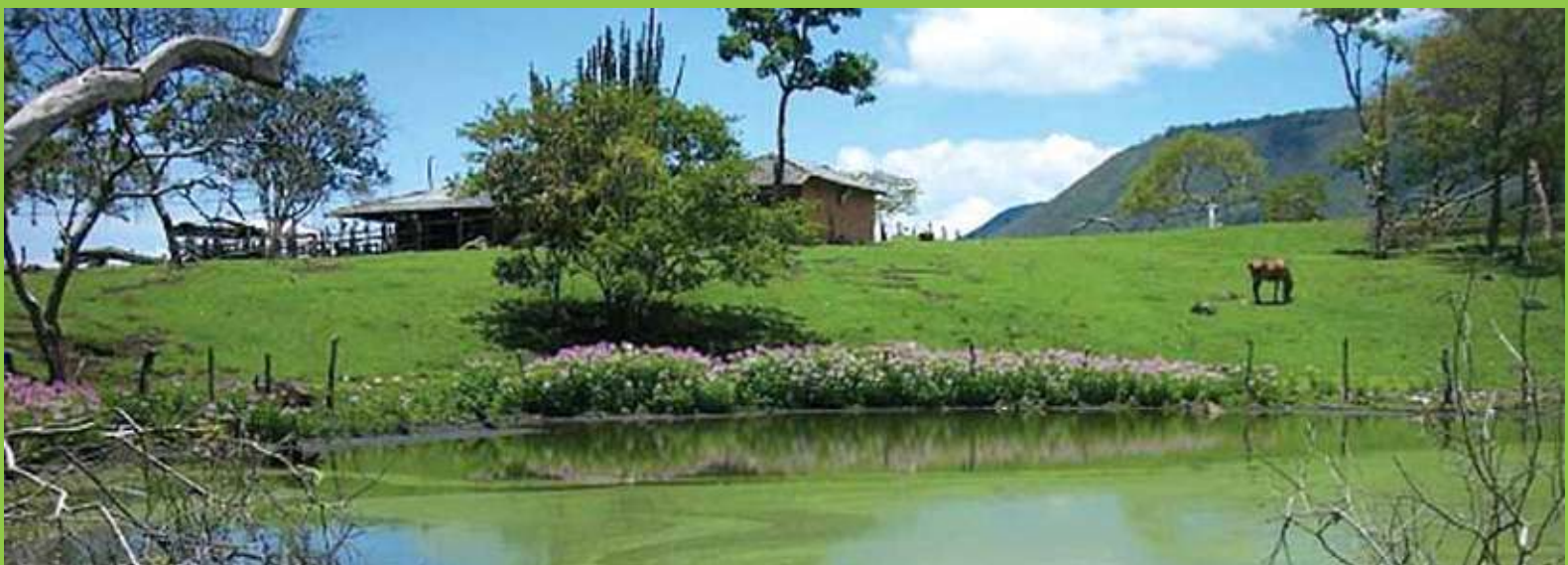
Laguna de Santagueda