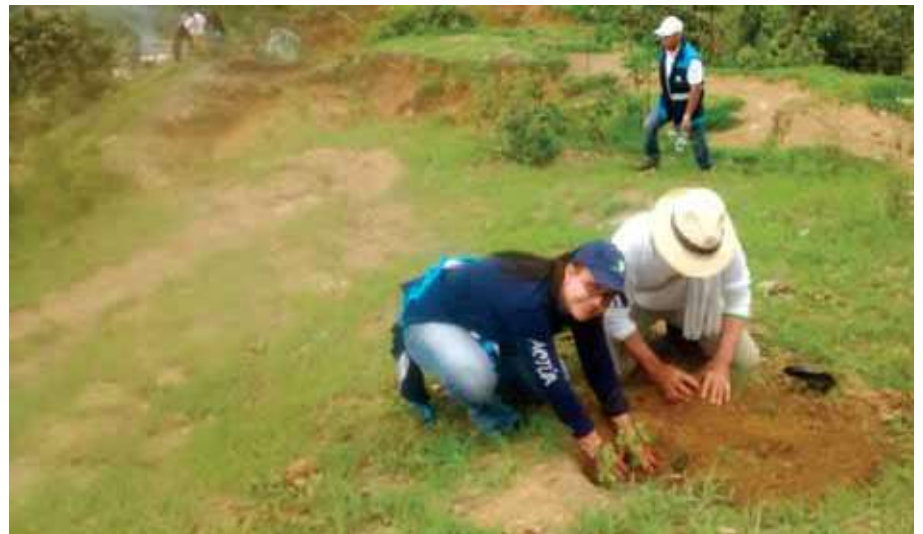
Jornada de reforestación municipio de Buriticá