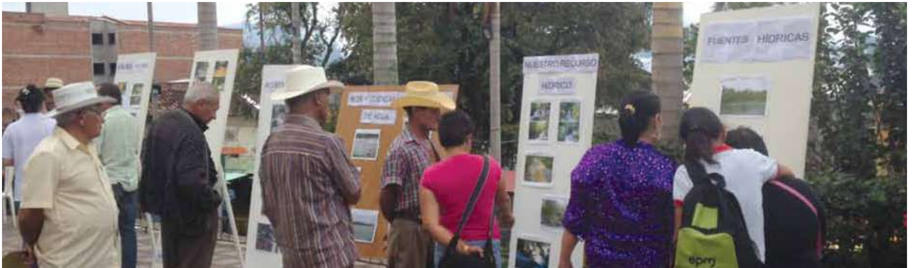
Exposición fotográfica en el parque del municipio de Toledo