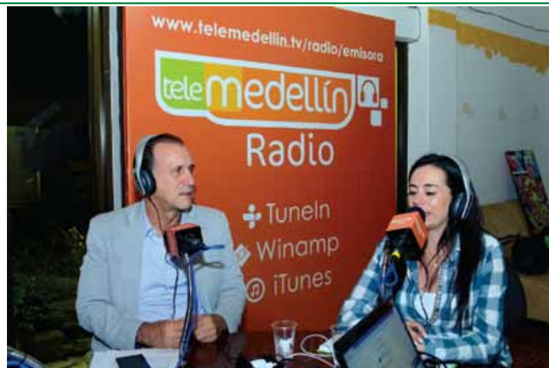
Sobre la Mesa, para conversar en confianza sobre la hidroeléctrica Ituango”, un programa de la estrategia radial del Grupo EPM. Escúchelo en directo a través de: http://radio.telemedellin.tv/

Con el propósito de informar a las comunidades los avances en las obras de la Hidroeléctrica Ituango y los programas y proyectos que están contribuyendo a mejorar la calidad de vida de los habitantes de los municipios del área de influencia, así como recibir sus inquietudes y sus propuestas, lo invitamos muy especialmente para que escuche los diferentes programas radiales que estamos produciendo en las emisoras locales: