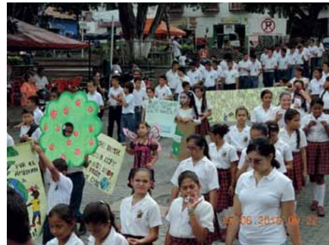
Desfile por las calles del municipio de Liborina