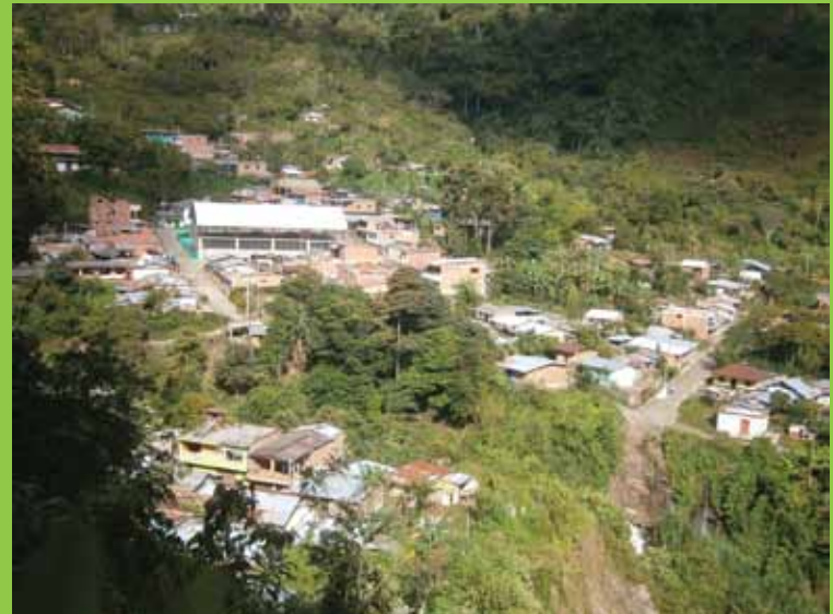
Corregimiento Los Llanos / Foto: Ubeimar Arango

Cuenta la historia, que unos campesinos venidos del municipio de Buriticá, llamados Adon Tadeo David y Fulgencio Higueta salieron de cacería en busca de un oso, el cual encontraron y le dieron muerte en un lugar metido entre las imponentes y majestuosas montañas del occidente antioqueño. Estos cazadores vieron en este lugar, donde hoy se encuentra el parque del municipio de Peque, un terreno propicio para fundar una población. Es así como se narra el origen de este hermoso y acogedor municipio, denominado por propios y visitantes como “la verdadera capital de la montaña”.