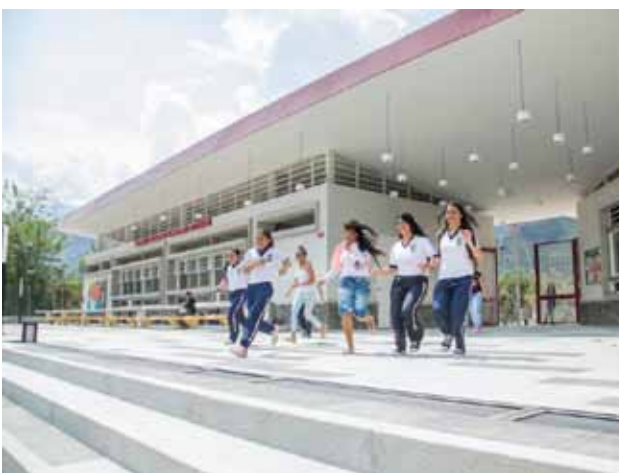
Parque Educativo, obra de la Gobernación de Antioquia