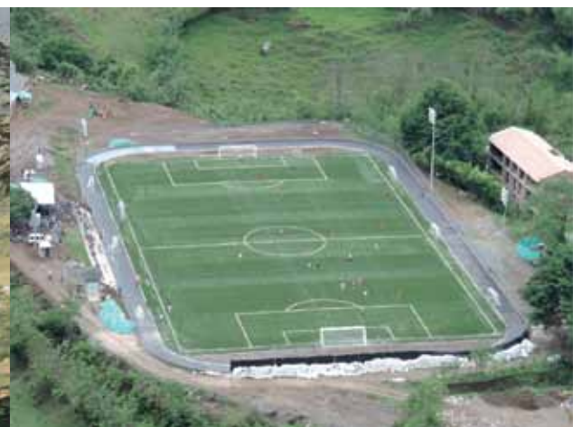
Cancha sintética

Todos estos hechos son para Peque y sus habitantes el mejor regalo en sus primeros 100 años como municipio, una conmemoración que oficialmente se realizó entre el 22 y el 28 de junio pasado y que congregó a toda la comunidad en torno a actividades de carácter cultural, artístico, deportivo y recreativo.