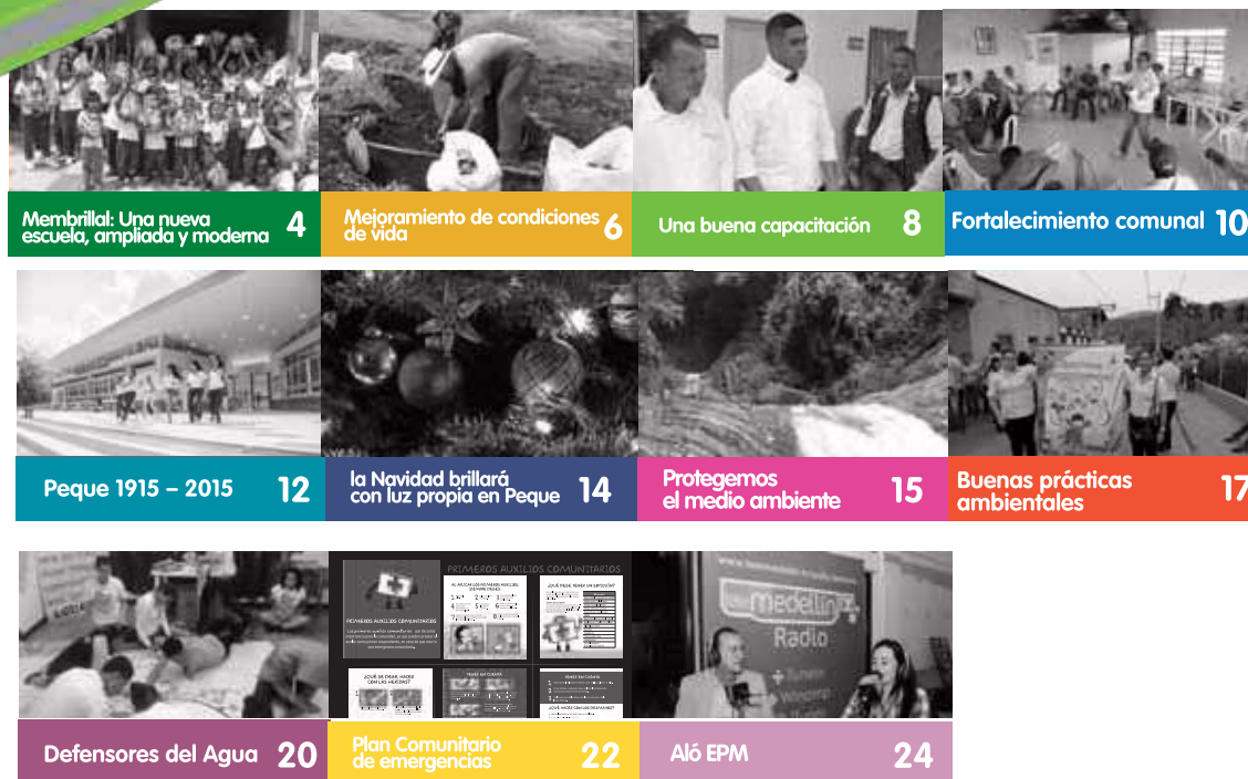
Membrillar: Una nueva escuela, ampliada y moderna 4 Mejoramiento de condiciones de vida 6 Una buena capacitación 8 Fortalecimiento comunal 10