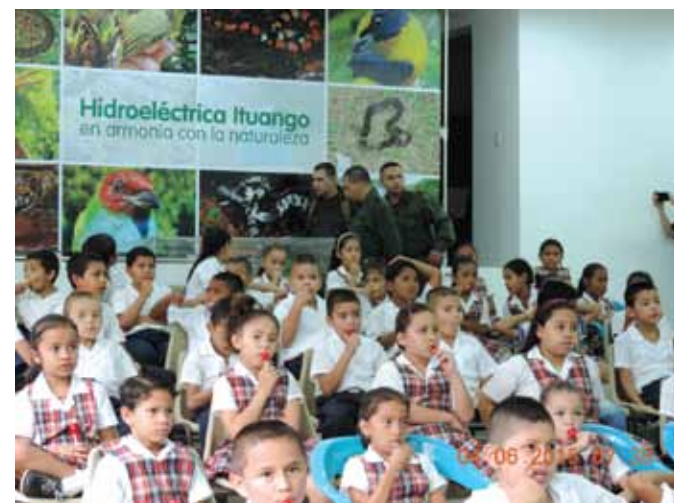
Institución Educativa San José, municipio de Sabanalarga