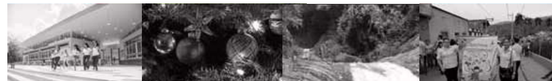
Peque 1915 - 2015 12 la Navidad brillará con luz propia en Peque 14 Protegemos el medio ambiente 15 Buenas prácticas ambientales 17