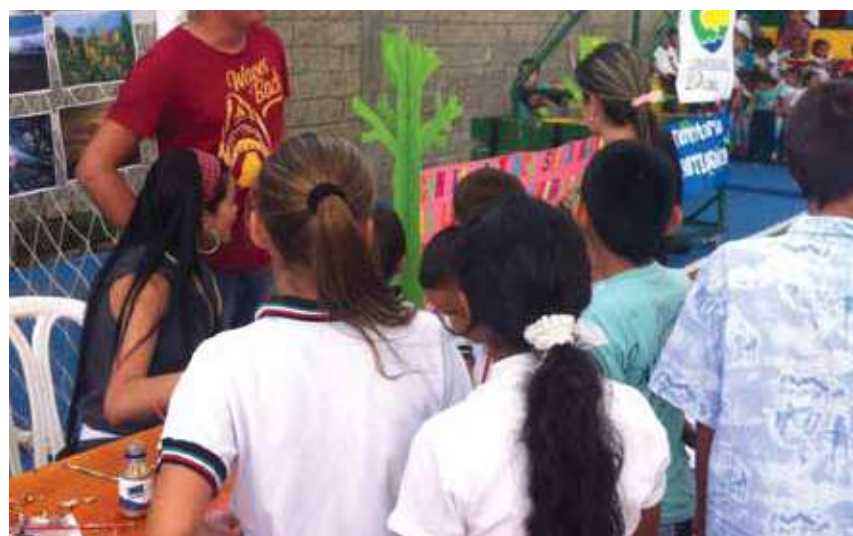
Actividades ambientales en la Institución Educativa Antonio Roldán, en Briceño