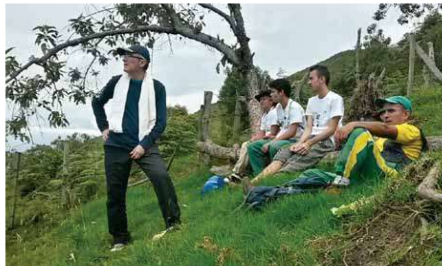
Lecturas del territorio en el municipio de Olaya