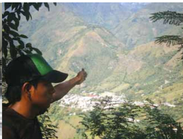
Panorámica del municipio