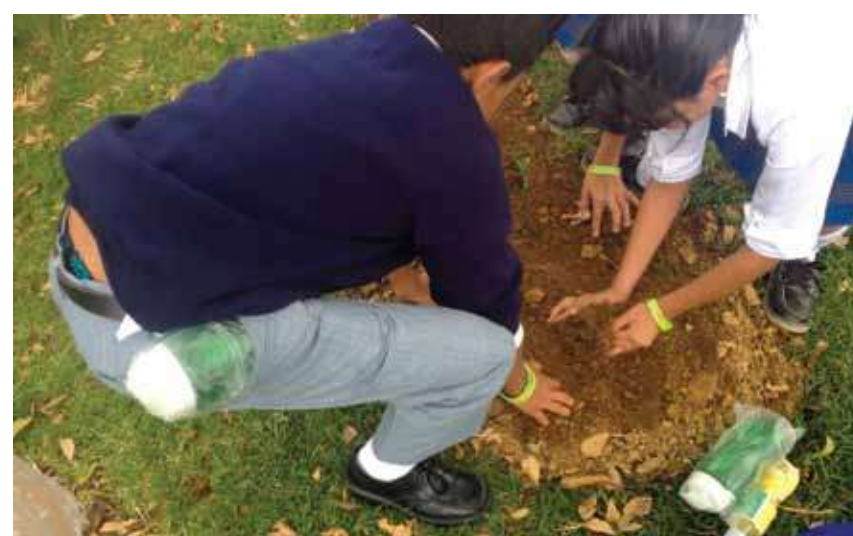
Siembra de plantas en el municipio de Yarumal