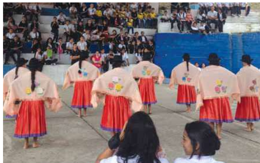
Celebración en el coliseo de San Andrés De Cuerquia