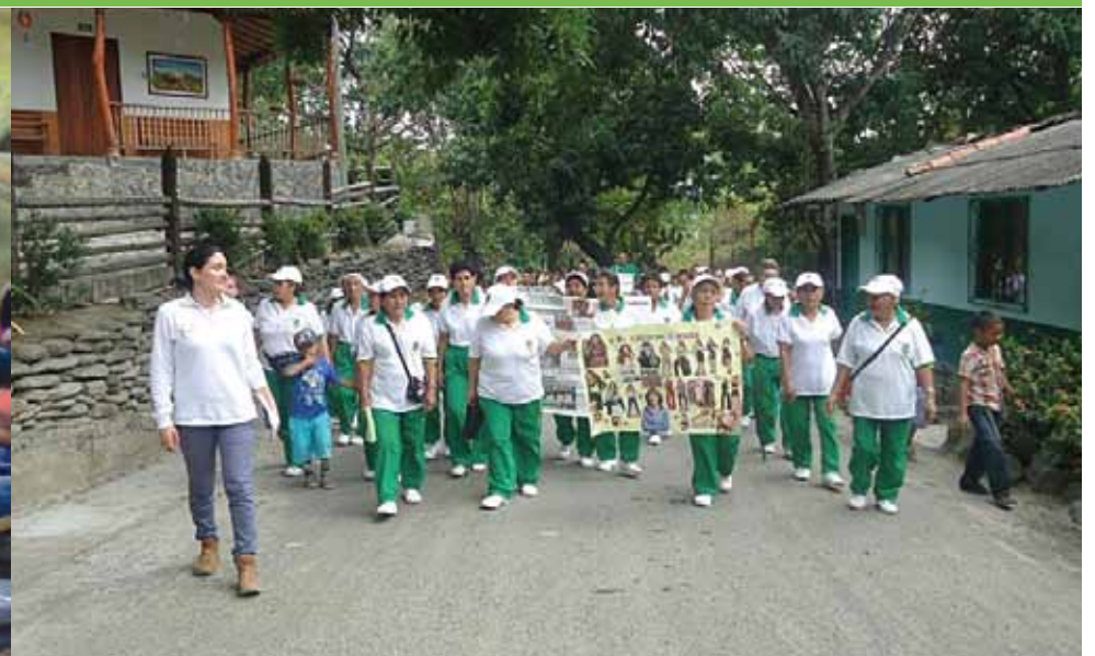
Actividad de sensibilización promoviendo el respeto por los derechos de las mujeres en el municipio de Olaya