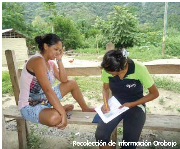
Recolección de información Orobajo

En el proceso de recuperación de memoria se ha planteado realizar actividades de investigación que involucren las Instituciones Educativas y los Centros de Educación Rural, al igual que personas de la comunidad, lo cual se encuentra estrechamente vinculado con la apropiación de la comunidad con su conocimiento tradicional. En este sentido se han realizado programas como el “Taller de mitos y leyendas de mi localidad” donde los habitantes del territorio plasman en dibujos los diferentes mitos y leyendas que han escuchado de las personas mayores de la comunidad, también se ha realizado un taller de fotografía para que los habitantes de las localidades recojan, según su punto de vista, los elementos de memoria cultural más importantes de su entorno.