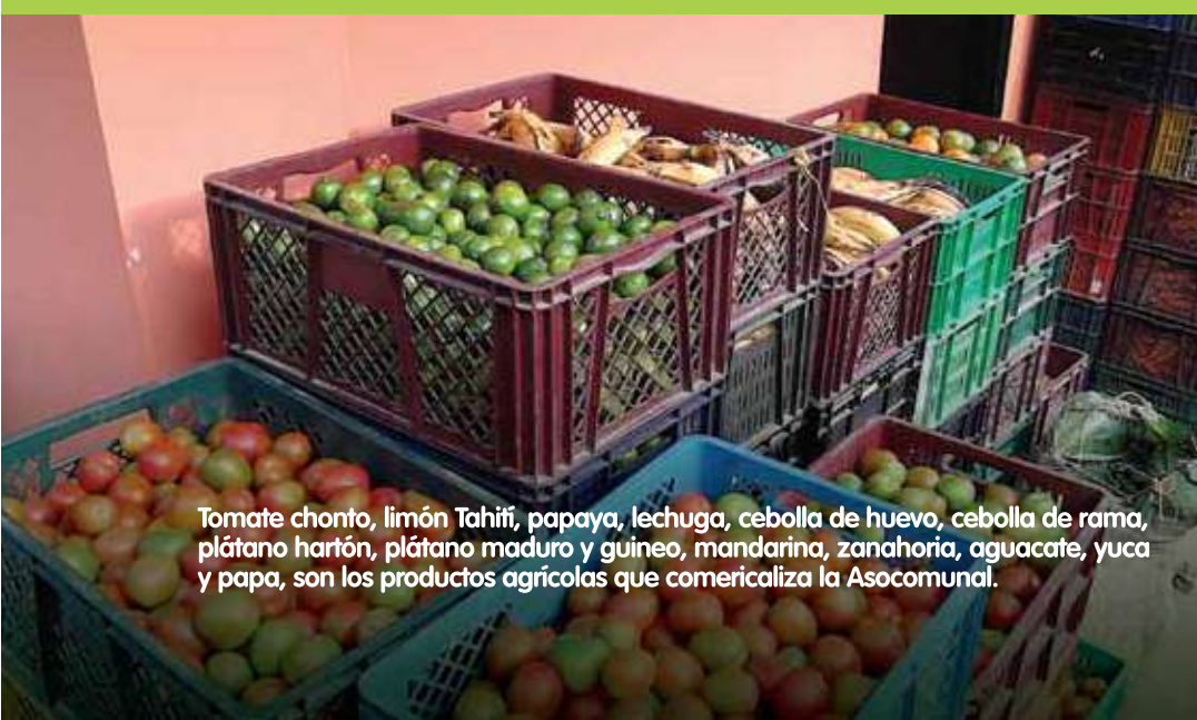
Tomate chonto, limón Tahití, papaya, lechuga, cebolla de huevo, cebolla de rama, plátano hartón, plátano maduro y guineo, mandarina, zanahoria, aguacate, yuca y papa, son los productos agrícolas que comercializa la Asocomunal.

Sus sueños apenas comienzan. Ya han pensado en comercializar en otras regiones y con otras empresas. Saben que los casinos se podrían ir o disminuir en cantidad de pedidos en algunos años. Por eso, desde ya, la Administración del Municipio, los productores de la Asocomunal y el equipo de Gestión Social del proyecto Hidroeléctrico Ituango están pensando en estrategias para mejorar la calidad de los productos y buscar nuevos mercados, quizás en la costa norte, aprovechando la salida que les brindará la vía que se construye entre el sitio de presa y Puerto Valdivia.