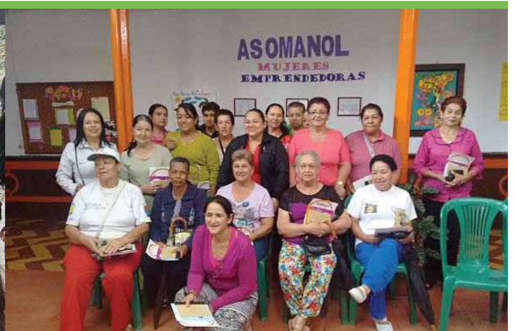
Actividad de sensibilización promoviendo el respeto por los derechos de las mujeres en el municipio de San Andrés de Cuerquia