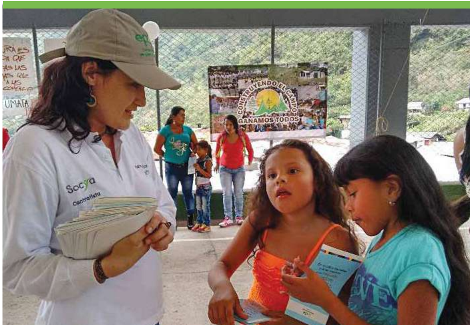
Actividad de sensibilización promoviendo el respeto por los derechos de las mujeres en el municipio de Peque.