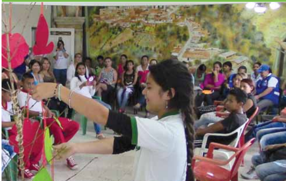
Acto simbólico de conmemoración del Día internacional por los derechos de las Mujeres en el Municipio de Buriticá

La conmemoración de esta importante fecha por parte del Proyecto Hidroeléctrico Ituango estuvo en sintonía también con la campaña de derechos humanos que el grupo EPM viene impulsando desde principios de este año en todas aquellas comunidades de los territorios en los que hace presencia y en donde uno de los lineamientos fundamentales es el respeto y la promoción de la equidad de género.