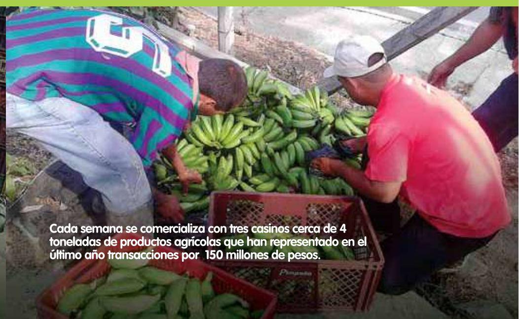
Cada semana se comercializa con tres casinos cerca de 4 toneladas de productos agrícolas que han representado en el último año transacciones por 150 millones de pesos.