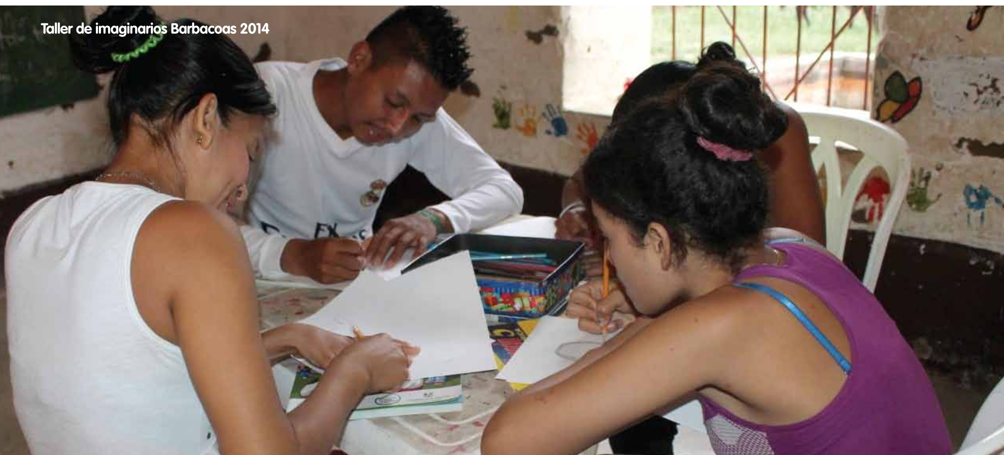
Taller de imaginarios Barbacoas 2014

Precisamente, debido a que esa visión de futuro se deberá reconfigurar, el tema de la memoria cobra importancia, pues permite repensarse en un espacio que se construye a partir del legado que cada comunidad, cada familia, cada persona deja y que reconoce, conserva y pone en práctica, en uso y en palabras la posibilidad de reinventar la noción de lo cotidiano en un nuevo territorio.