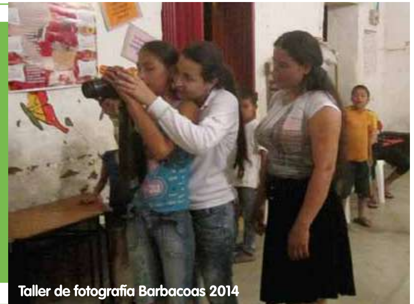
Taller de fotografía Barbacoas 2014

Desde el componente cultural del Proyecto Hidroeléctrico Ituango, se han llevado a cabo procesos claros e importantes para las comunidades, en donde la participación de las mismas ha sido esencial. En ese sentido se ha trabajado con conocimientos de memoria cultural, que son de sumo valor ya que ésta es un símbolo de preservación de la identidad de las colectividades, se convierte en una herramienta para conservar las identidades de las comunidades impactadas de manera directa.