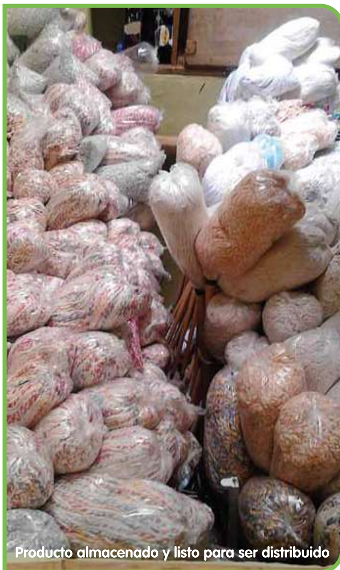
Producto almacenado y listo para ser distribuido

El poco capital con el que contaban no fue impedimento para que la asociación continuara adelante con su microempresa. Fue entonces cuando les llegó la oportunidad de participar por recursos de presupuesto participativo para lo cual se tuvieron que asesorar de otra asociación de la localidad que les tendió la mano. El proyecto obtuvo una gran votación comunitaria en la elección de los proyectos a realizarse con los recursos de planeación de presupuesto participativo del Plan Integral Hidroeléctrica Ituango con lo cual se le dio un impulso a la microempresa.