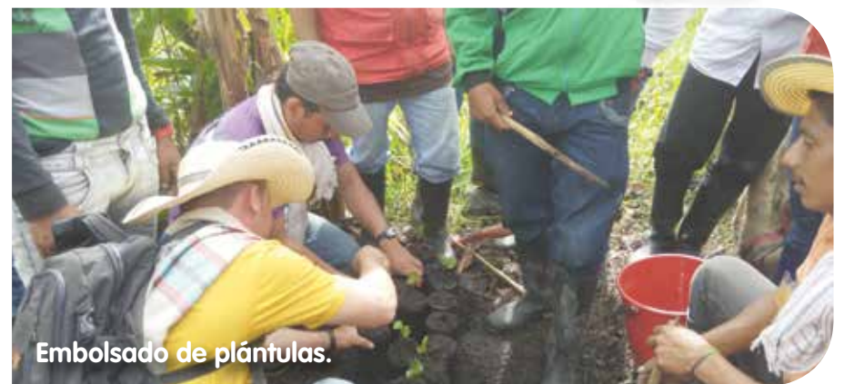
Embolsado de plántulas.

En el municipio de Peque se vive la cosecha cafetera, al igual que en otros municipios del occidente y norte de Antioquia. En el marco de este acontecimiento económico se realizó la gira demostrativa de café con 20 representantes de las familias de Barbacoas interesadas en este tipo de proyectos productivos. Esta fue la oportunidad para conocer el proceso de producción, la vida familiar alrededor de este fruto y la cultura cafetera en su máxima expresión.