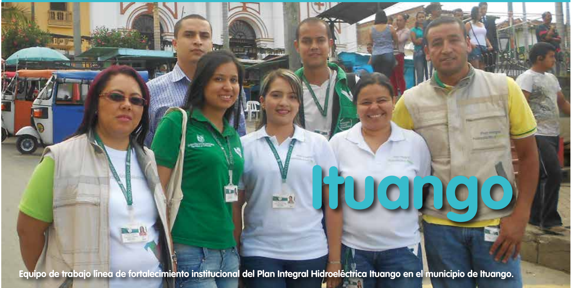
Equipo de trabajo línea de fortalecimiento institucional del Plan Integral Hidroeléctrica Ituango en el municipio de Ituango.

Nuestro equipo en Ituango lo conforma un gestor de Derechos Humanos, una profesional de ruta integral de familias víctimas del conflicto armado, dos psicólogas de reconstrucción del tejido social, una agente local de prevención para Entornos Protectores y una trabajadora social de apoyo a la Comisaría de Familia.