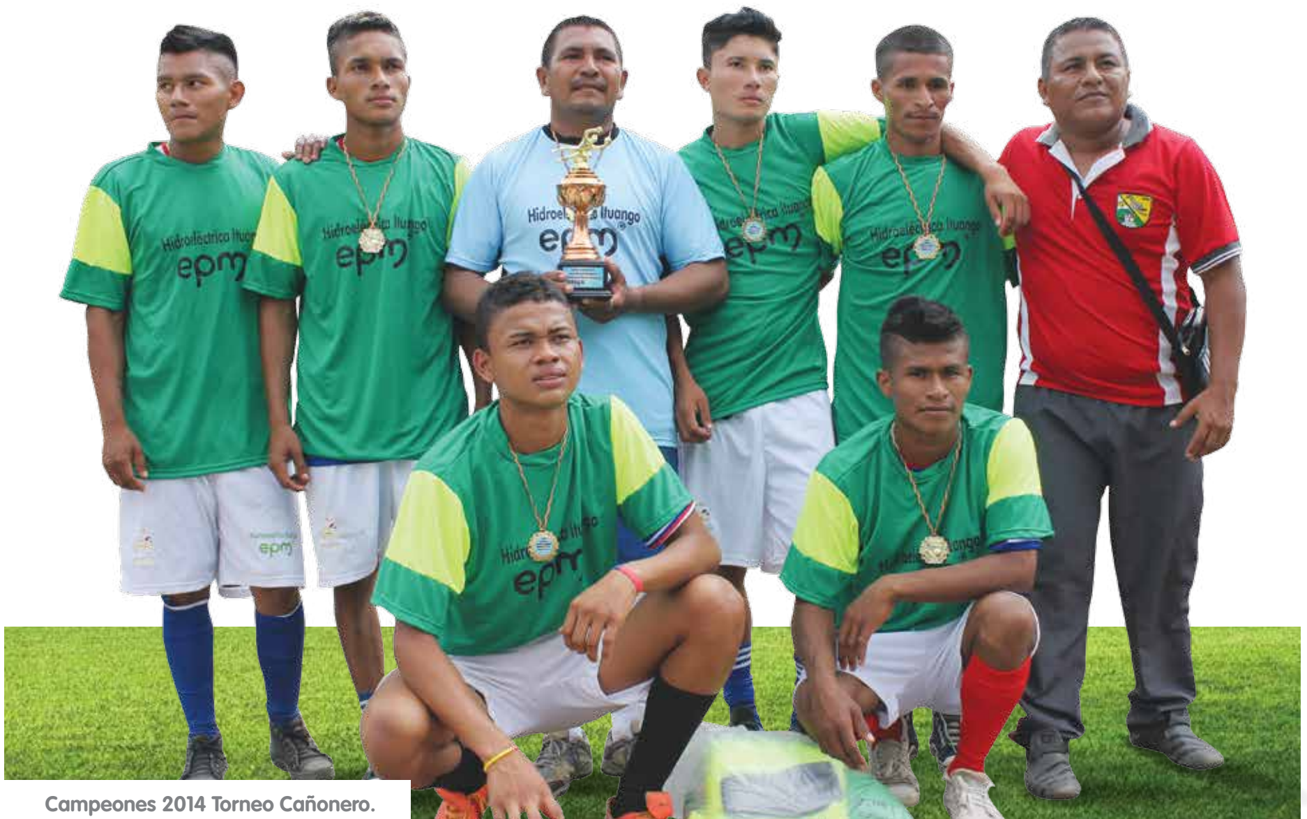
Campeones 2014 Torneo Cañonero.

Felicitaciones a los ganadores, a la administración municipal de Sabanalarga, a la Hidroeléctrica Ituango y a todas las personas que hicieron parte de este evento, ya que fue posible que su realización fuera todo un éxito. También a todas las familias que pertenecen a la Vereda de Oroabajo les agradecemos por su acogida.