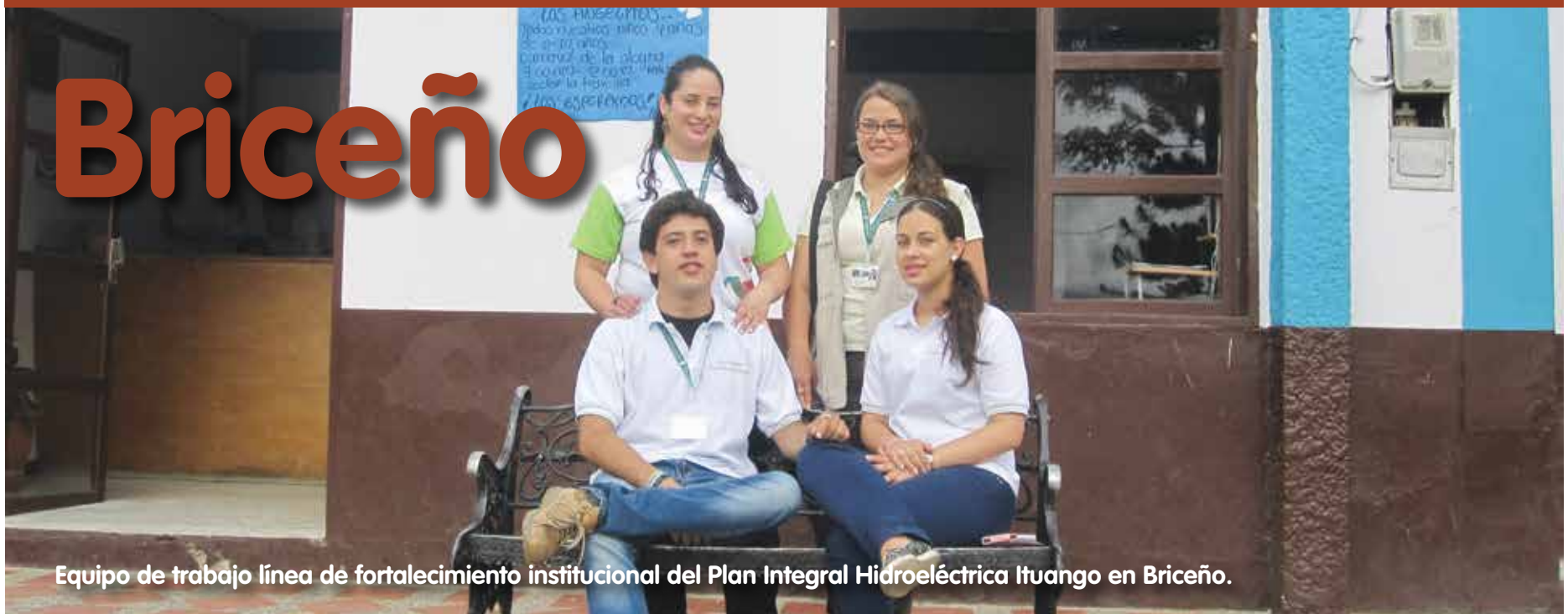
Equipo de trabajo línea de fortalecimiento institucional del Plan Integral Hidroeléctrica Ituango en Briceño.

El trabajo con víctimas del conflicto armado en Briceño se ha evidenciado en la labor que nuestros profesionales vienen adelantando. Hemos conformado cuatro grupos de motivación y apoyo mutuo en la zona urbana y la vereda El Roblal, además se ha acompañado a la mesa de víctimas y se han brindado talleres de formación en DDHH y prevención de accidentes por minas antipersonal; de igual forma venimos realizando talleres de guitarra clásica con adultos mayores víctimas.