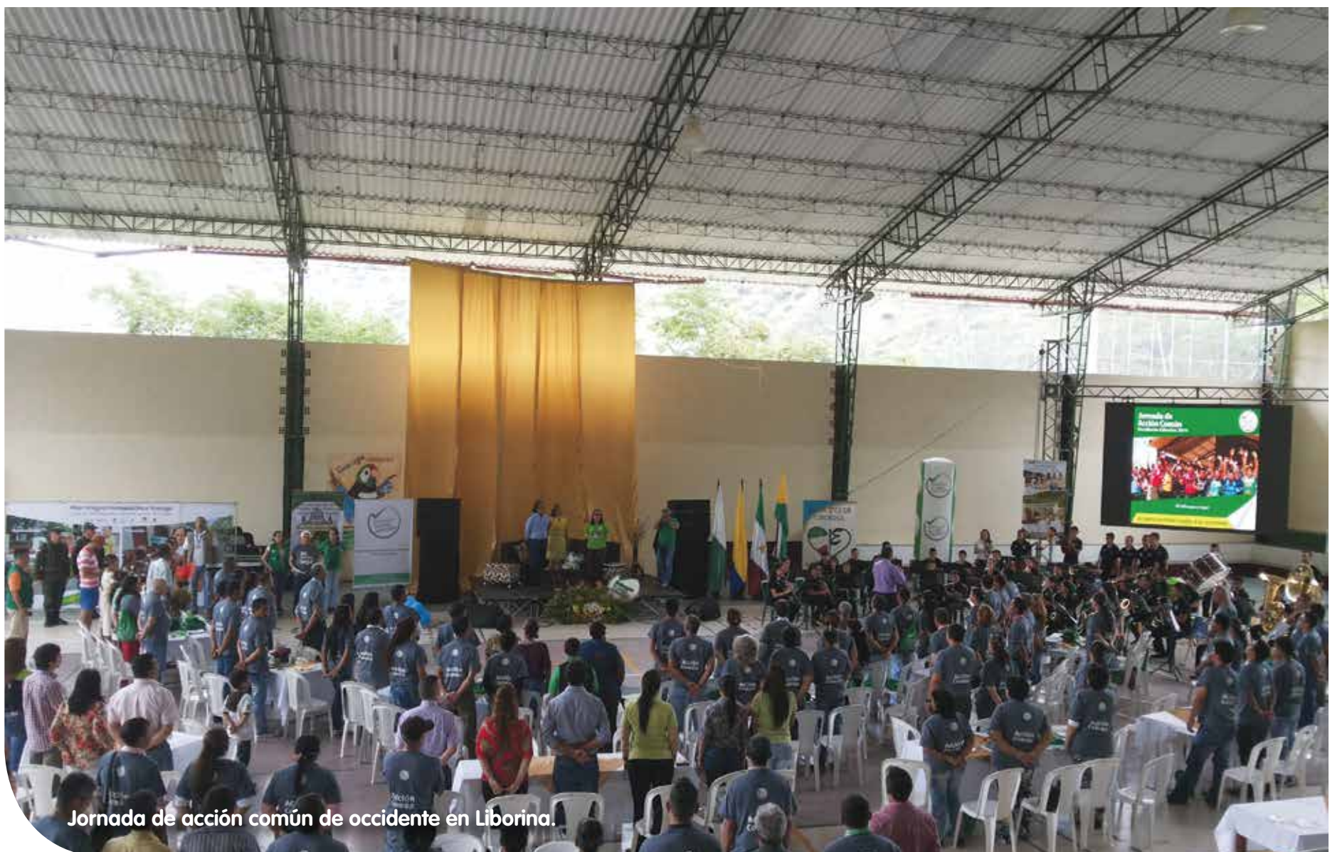
Jornada de acción común de occidente en Liborina.