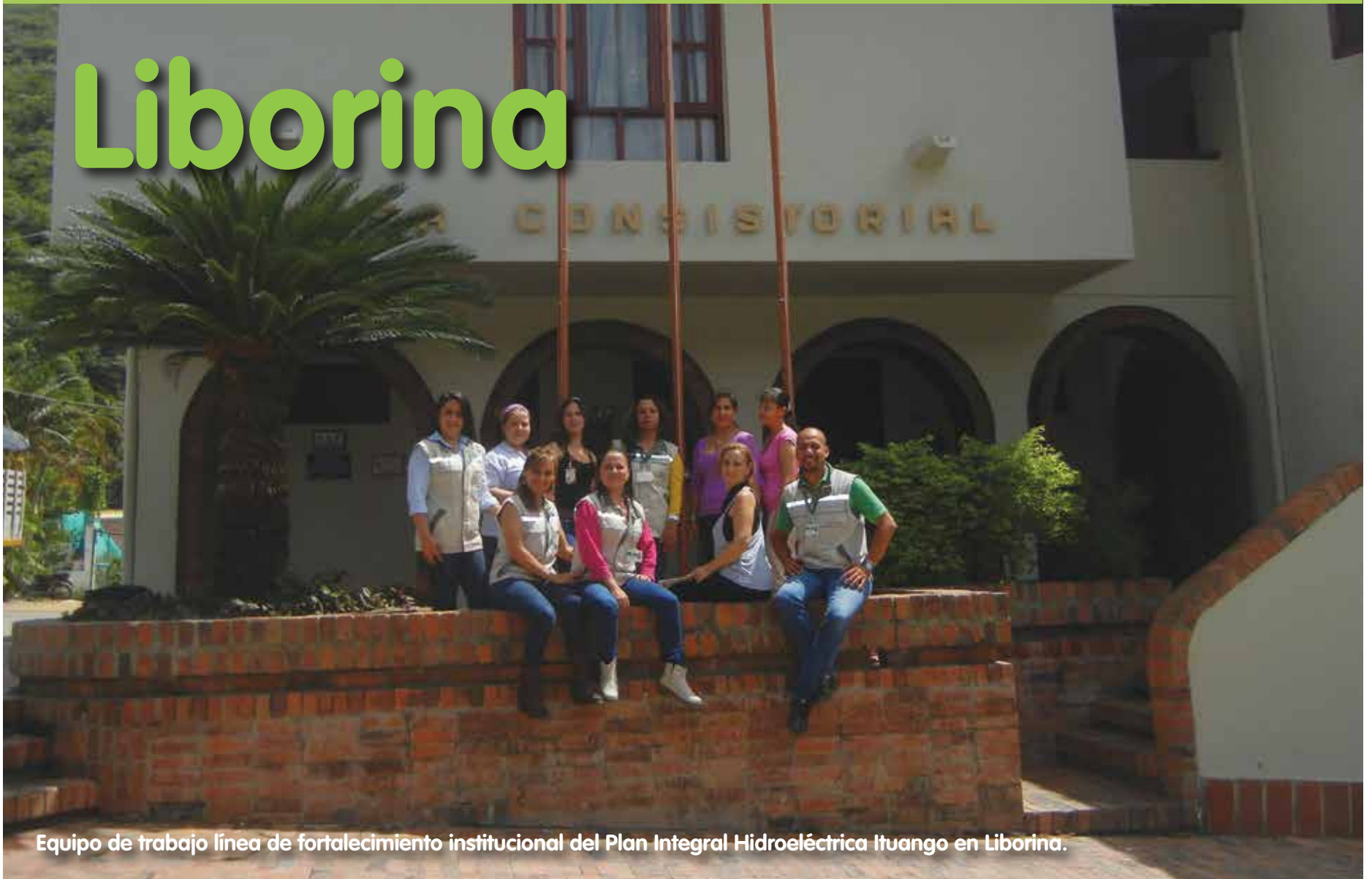
Equipo de trabajo línea de fortalecimiento institucional del Plan Integral Hidroeléctrica Ituango en Liborina.

Hemos realizado jornadas de atención a la población vulnerable mediante la metodología “Carrusel de la paz”, con intervenciones para la prevención de conductas violentas, la promoción de Derechos Humanos y ley 1448 de 2011. Estas jornadas se han realizado en zona urbana y rural y han participado unas 700 personas.