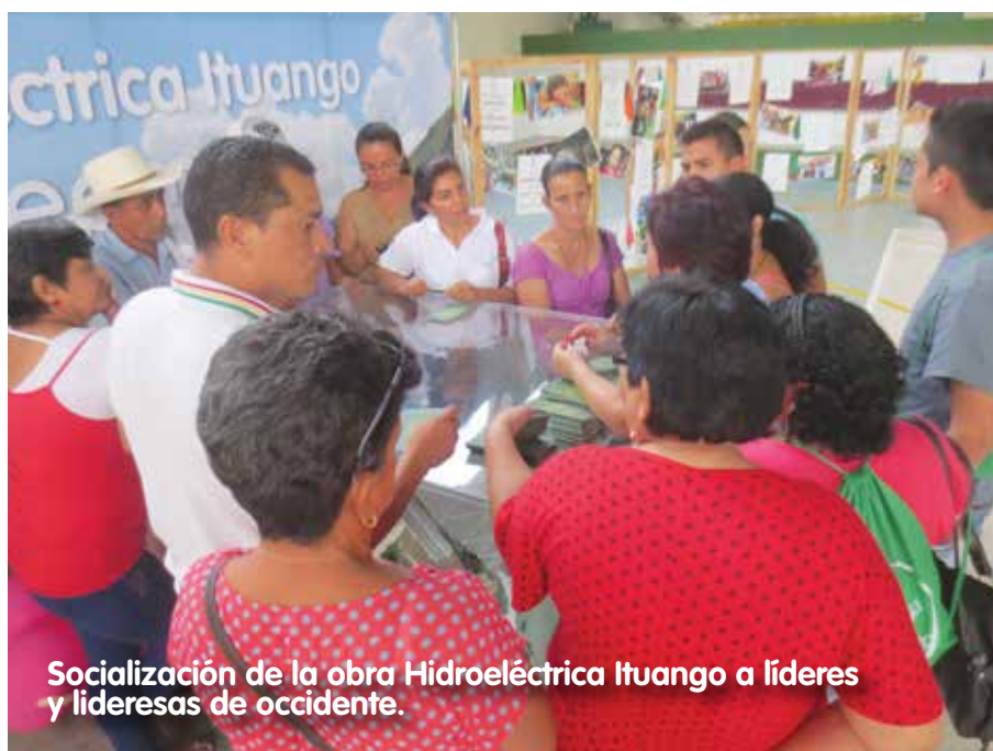
Socialización de la obra Hidroeléctrica Ituango a líderes y lideresas de occidente.

En este evento también participó el Gobernador de Antioquia Sergio Fajardo Valderrama quien señaló que una de las grandes conclusiones en la Jornada de Acción Común del Occidente antioqueño, es que el programa de Planeación y Presupuesto Participativo es una acción de paz que permite que las comunidades históricamente asediadas por la violencia y la falta de oportunidades participen de las decisiones públicas y puedan acceder a los presupuestos para suplir sus necesidades.