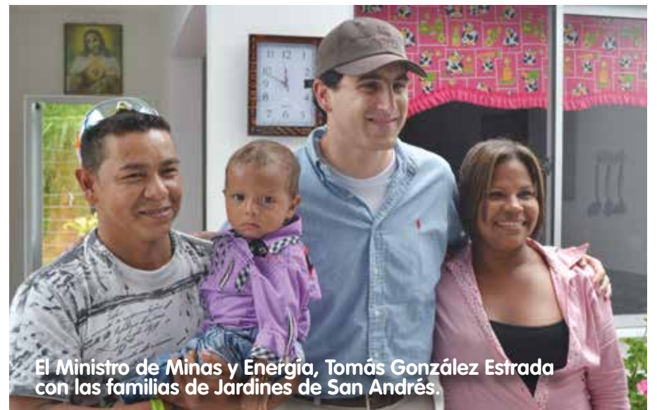
El Ministro de Minas y Energía, Tomás González Estrada con las familias de Jardines de San Andrés.