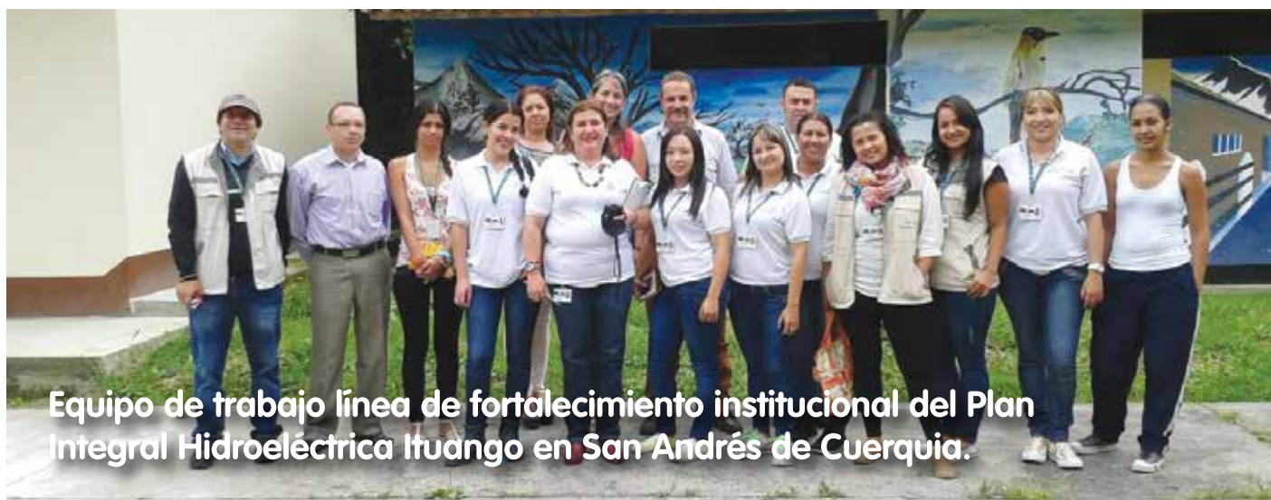
Equipo de trabajo línea de fortalecimiento institucional del Plan Integral Hidroeléctrica Ituango en San Andrés de Cuerquia.

Personería: 861 82 06 Ext.115 Comisaría de familia: 861 82 06 EXT. 116