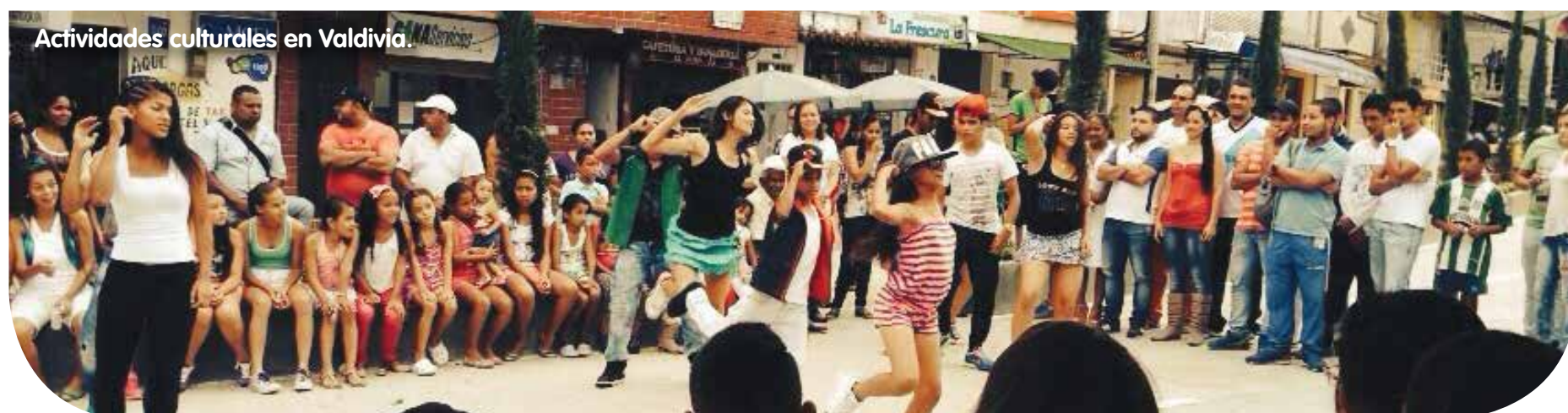
Actividades culturales en Valdivia.

En la próxima edición les compartiremos el balance de estos eventos en donde los protagonistas fueron los niños, niñas, adolescentes.