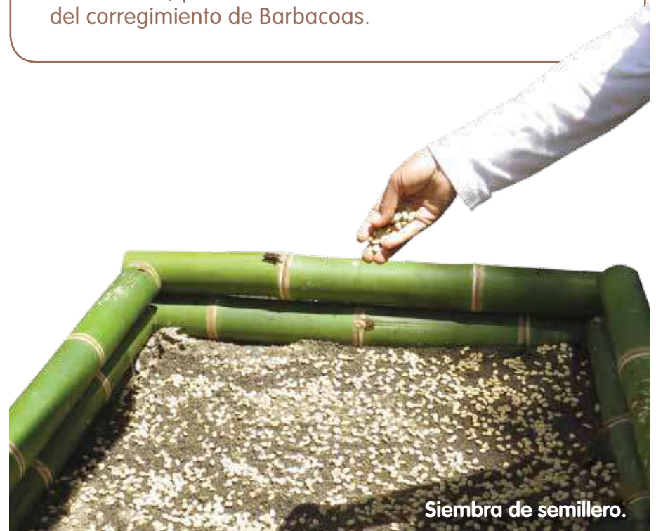
Siembra de semillero.