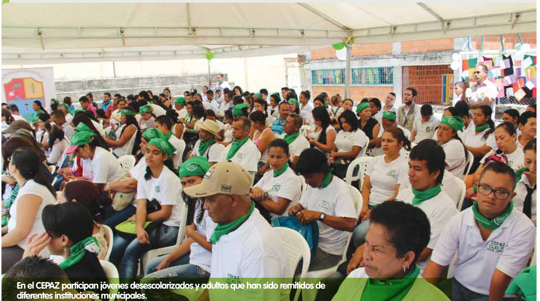
En el CEPAZ participan jóvenes desescolarizados y adultos que han sido remitidos de diferentes instituciones municipales.

Este centro, hace parte de la línea de Fortalecimiento Institucional del Plan Integral Hidroeléctrica Ituango, que busca fortalecer la presencia del Estado en los territorios. Para esto, se ejecutan 20 proyectos entre los que se destacan el fortalecimiento a las personerías, comisarías de familia, el programa entornos protectores, educación en riesgo de minas y el acompañamiento psicosocial a víctimas del conflicto armado.