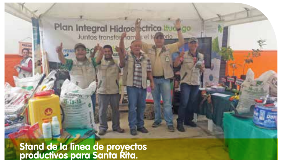
Stand de la línea de proyectos productivos para Santa Rita.