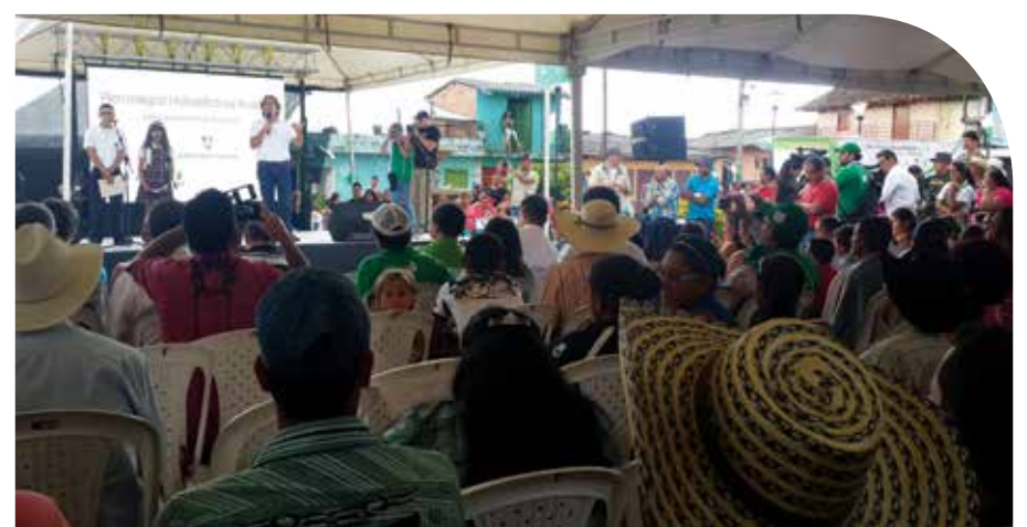
Gobernador de Antioquia, Sergio Fajardo Valderrama.

Por su parte, el Gobernador de Antioquia, Sergio Fajardo Valderrama, destacó “todos los esfuerzos que se realizan en conjunto son una forma de abrir la puerta de las oportunidades y cómo, con la participación decidida de la comunidad rural, urbana, educativa y la administración municipal, con estos proyectos construimos la paz en el territorio.”