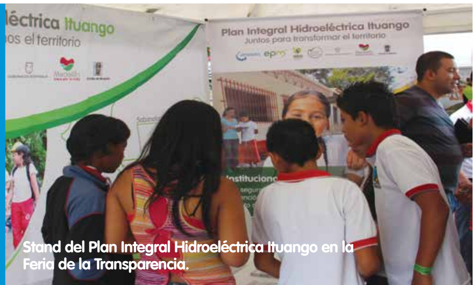
Stand del Plan Integral Hidroeléctrica Ituango en la Feria de la Transparencia.

En la Feria de la Transparencia, la comunidad del norte de Antioquia fue invitada a Ituango para conocer cómo se administran, cómo se contrata y se cuidan los recursos públicos, cómo se formalizan sus proyectos productivos y en qué se van a invertir estos recursos en el 2015.