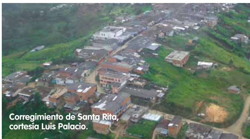
Corregimiento de Santa Rita, cortesía Luis Palacio.

En Ituango, El corregimiento Santa Rita de Sinitavé cuenta con más de 7.000 habitantes, de los cuales su gran mayoría habitan en el campo. Para llegar a Santa Rita, se deben recorrer más de 3 horas en camioneta o más de 7 horas en bus escalera desde el casco urbano de Ituango, cuando las condiciones de la vía lo permiten, ya que se transita sobre una carretera destapada que atraviesa la montañosa cordillera occidental.