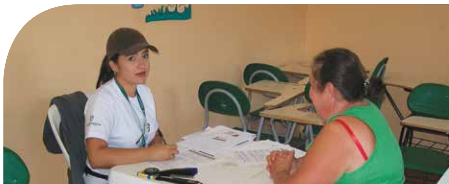
Jornada de atención Casa Móvil de Justicia.

Todos estos son proyectos y obras que ya comenzaron a ejecutarse. Adicionalmente, en Santa Rita también estuvimos durante varios días con la casa móvil de justicia, con servicios gratuitos que tanto el gobierno nacional, local y de la Gobernación de Antioquia, tienen para toda la comunidad. Es con una institucionalidad fortalecida que nos preparamos para la paz, pasamos la página de la violencia y escribimos la de las oportunidades.