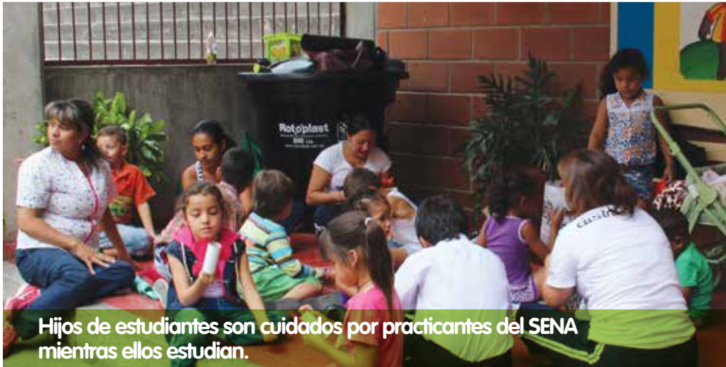
Hijos de estudiantes son cuidados por practicantes del SENA mientras ellos estudian.

La administración municipal, la Institución Educativa San Andrés y la Universidad Católica de Oriente son aliados estratégicos que permitieron la creación y el funcionamiento del Centro de Formación para la Paz.