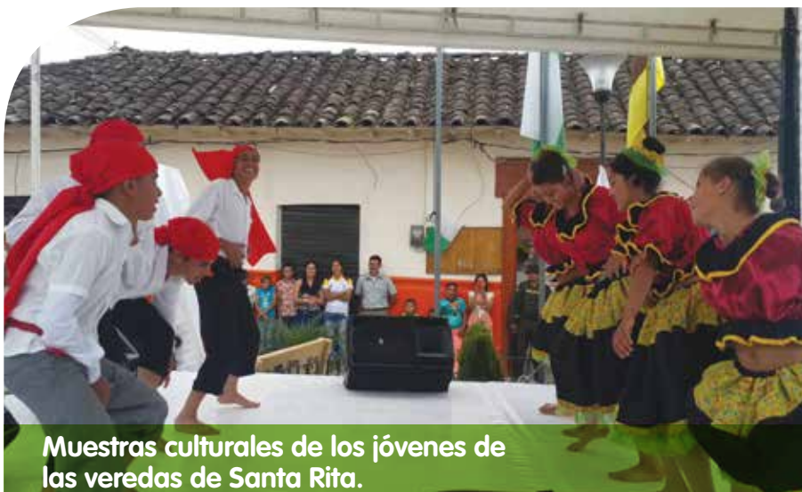
Muestras culturales de los jóvenes de las veredas de Santa Rita.

La Feria de la productividad y la cultura, fue una iniciativa de la comunidad en donde las familias campesinas de las diferentes veredas del corregimiento expusieron sus productos agrícolas, emprendimientos productivos y muestras culturales. Así mismo, se contó con un stand de café especial Sinativé, sello de orgullo del corregimiento, de la organización Asproasir y un stand de proyectos productivos del Plan Integral Hidroeléctrica Ituango.