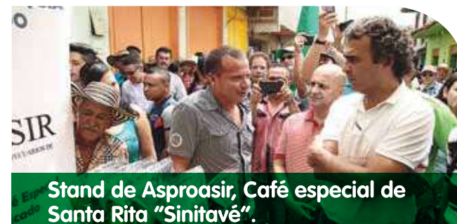
Stand de Asproasir, Café especial de Santa Rita "Sinitavé".

En el evento estuvieron compartiendo con la comunidad el Gobernador de Antioquia, Sergio Fajardo Valderrama; el Vicealcalde de Gestión Territorial