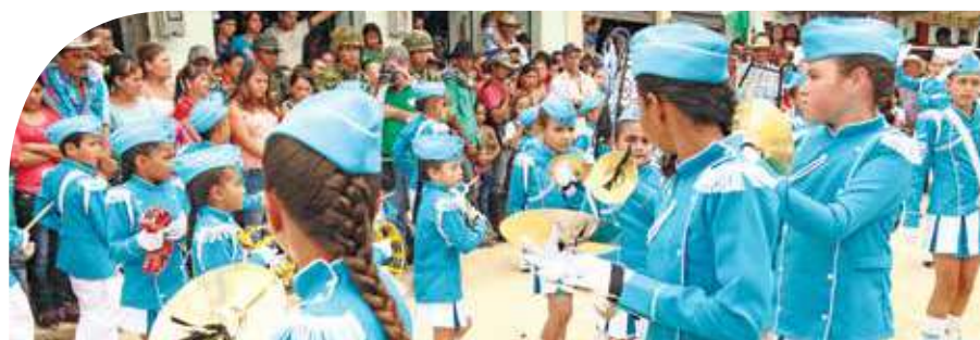
Con nuevos instrumentos musicales, niños y niñas cumplirán su anhelo de continuar con su formación musical.

Uno de los programas en los que participó la comunidad educativa de Santa Rita fue el concurso de iniciativas juveniles, en el que presentaron un proyecto para la dotación de instrumentos musicales para estudiantes de primaria de la banda Infantil músico marcial, Toques de Esperanza de la Institución Educativa Luis María Preciado, y como parte de la celebración, este día se entregaron los instrumentos a los niños y las niñas.