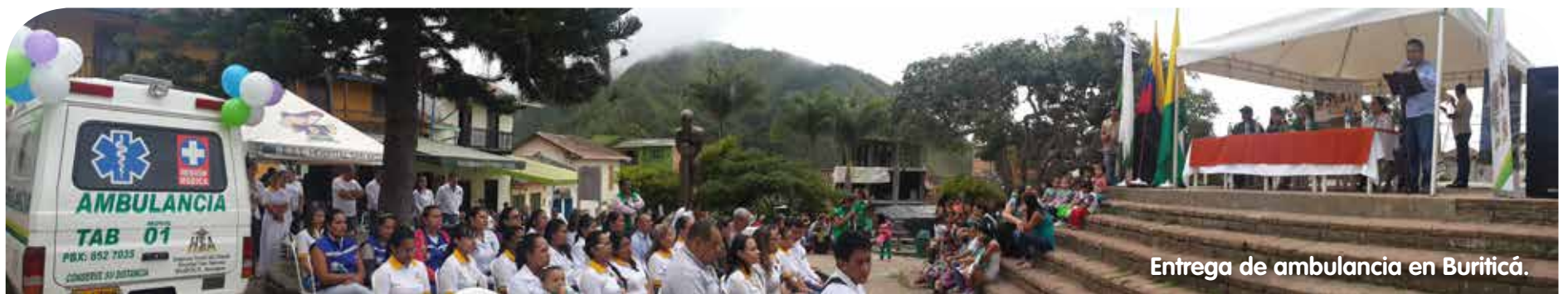
Entrega de ambulancia en Buriticá.

de equipos biomédicos, infraestructura, telemedicina y la estrategia de atención primaria en salud, denominada “Salud Contigo: Llegamos lejos para estar más cerca de ti”, la cual lleva servicios de salud, promoción y prevención a las familias más alejadas de estas localidades.