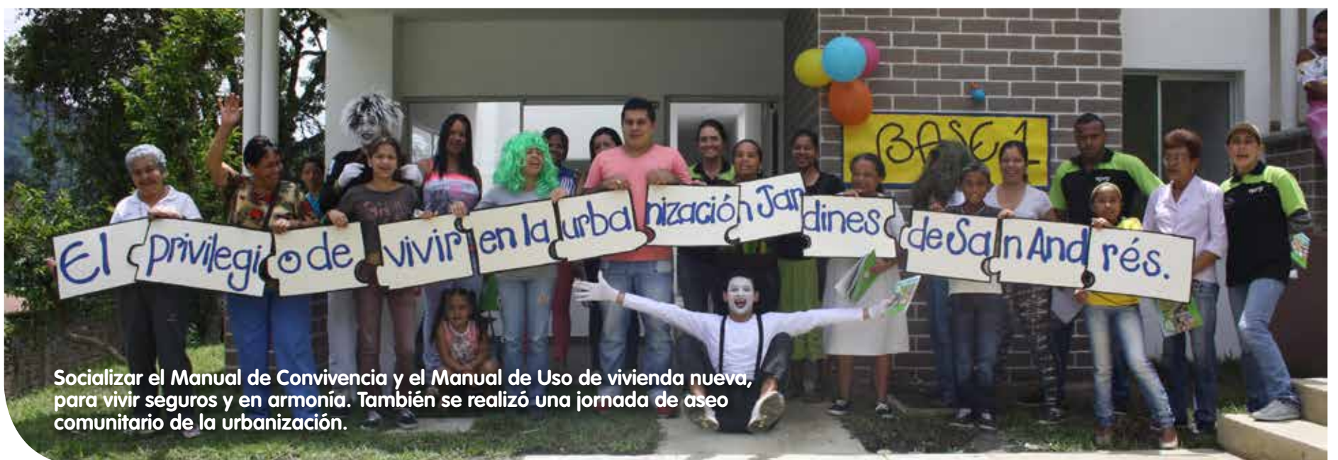
Socializar el Manual de Convivencia y el Manual de Uso de vivienda nueva, para vivir seguros y en armonía. También se realizó una jornada de aseo comunitario de la urbanización.