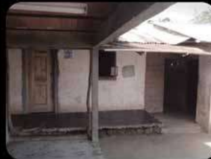
Antes de Aldeas