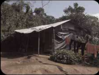
Antes de Aldeas