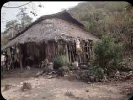
Antes de Aldeas