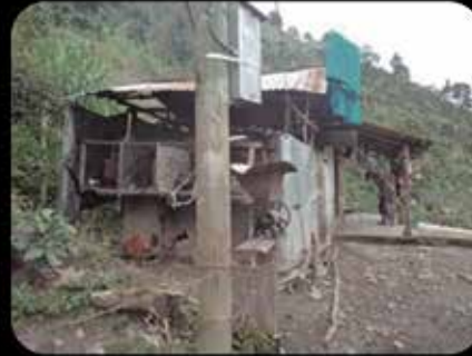
Antes de Aldeas