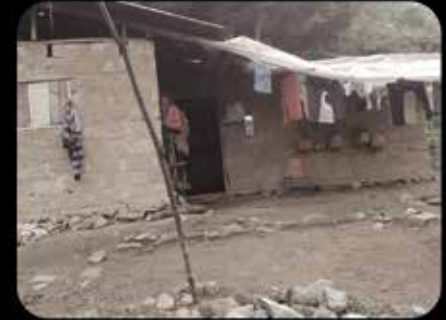
Antes de Aldeas