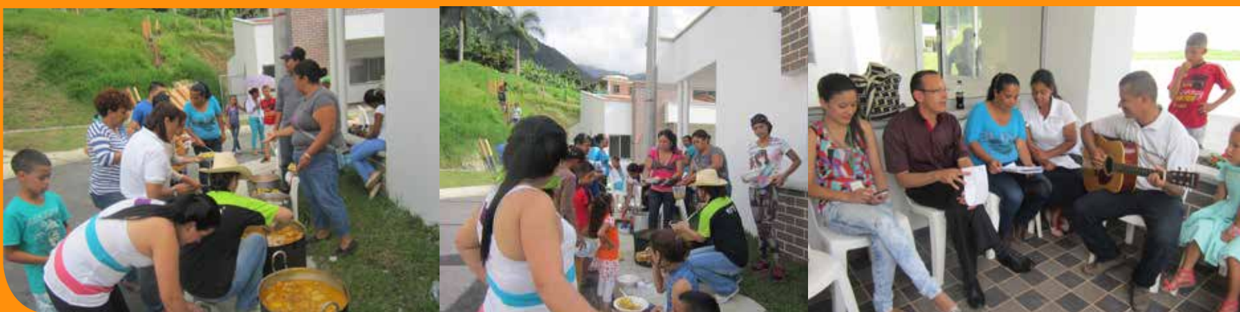
Hasta hubo tiempo para sancocho y hasta para trovar sobre el buen futuro de San Andrés de Cuerquia y Jardines de San Andrés. El alcalde nos acompañó.