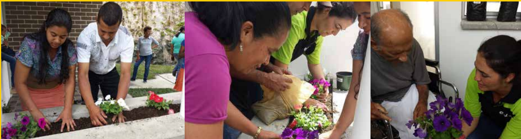
Si algo no puede faltar en Jardines de San Andrés, es la belleza de la naturaleza. Las familias sembraron sus propios jardines.