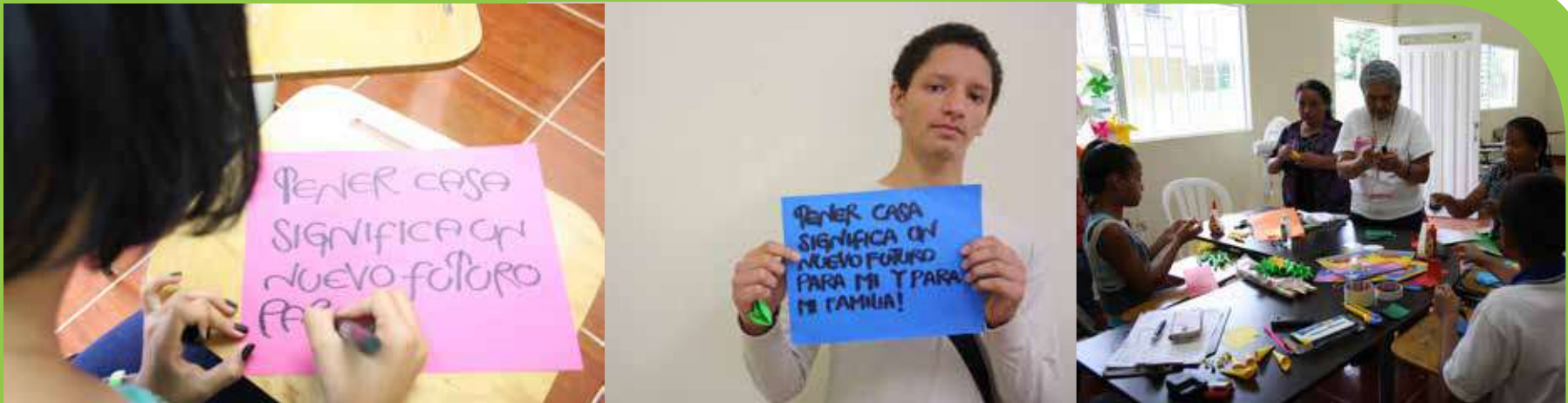
Elaborar carteleras y avisos que las familias utilizarán en el evento de entrega oficial de Jardines de San Andrés, en el mes de agosto.