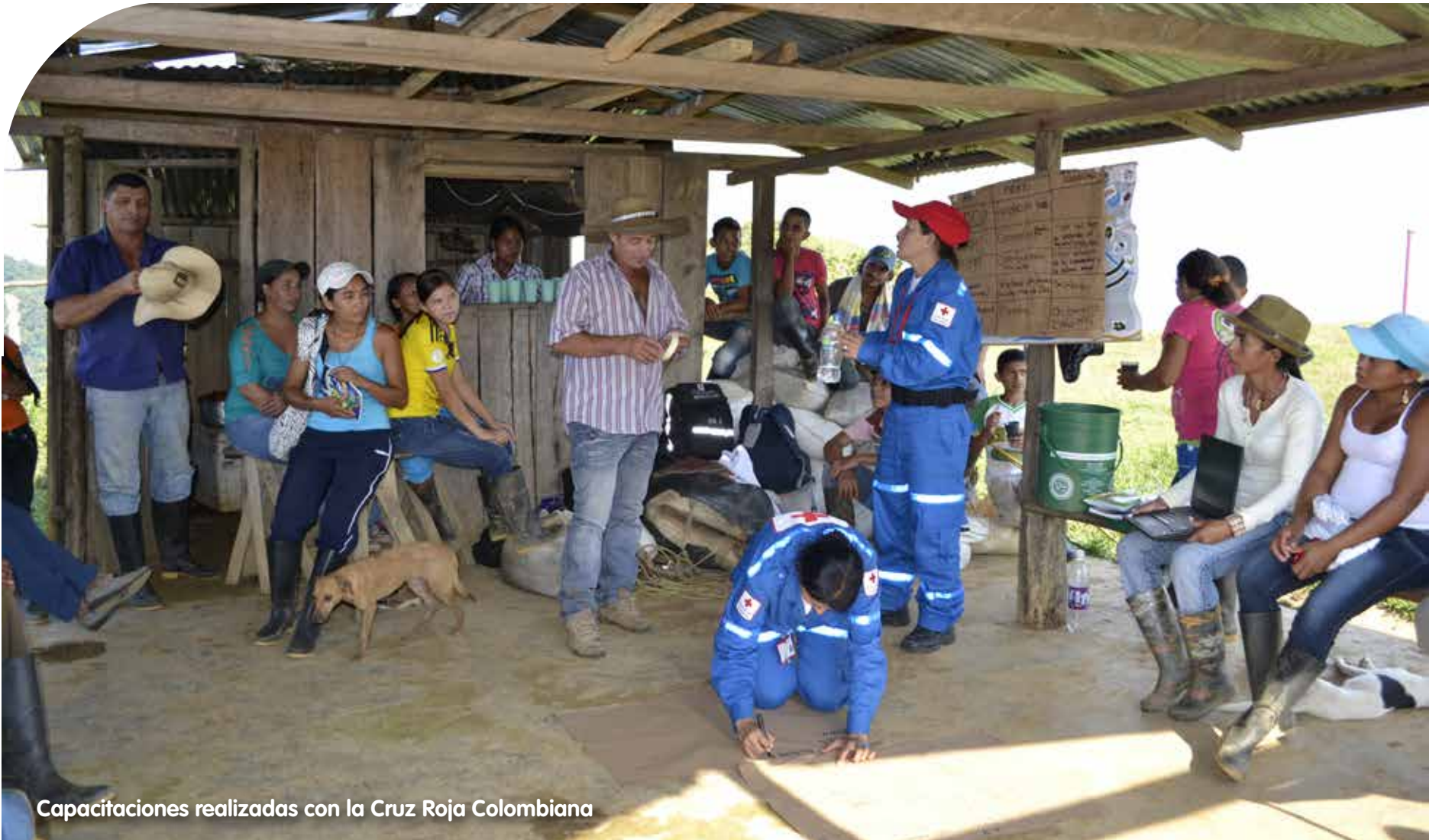
Capacitaciones realizadas con la Cruz Roja Colombiana