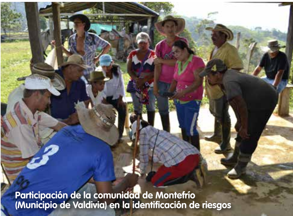
Participación de la comunidad de Montefrío (Municipio de Valdivia) en la identificación de riesgos