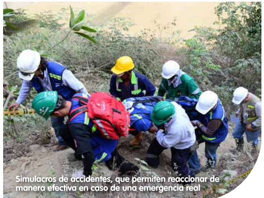
Simulacros de accidentes, que permiten reaccionar de manera efectiva en caso de una emergencia real