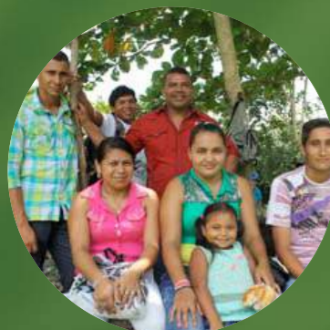
Acompañantes del equipo campeón disfrutaron entre amigos