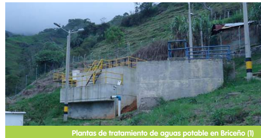
Plantas de tratamiento de aguas potable en Briceño (1)