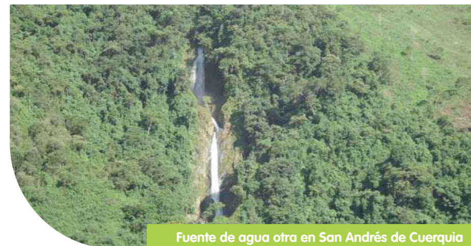
Fuente de agua otra en San Andrés de Cuerquia