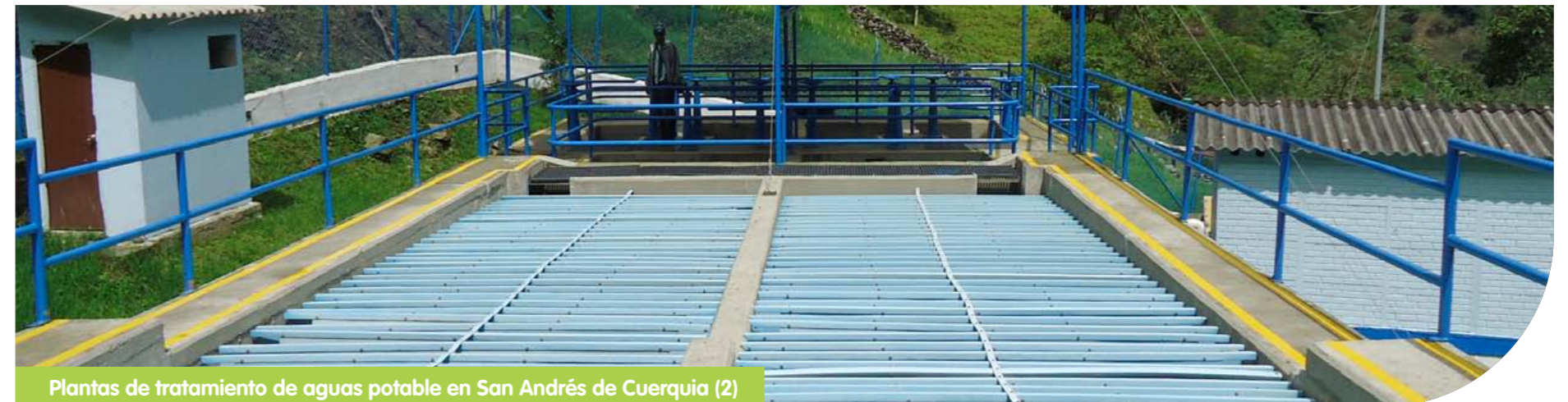
Plantas de tratamiento de aguas potable en San Andrés de Cuerquia (2)