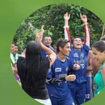
Celebración de La Coposa