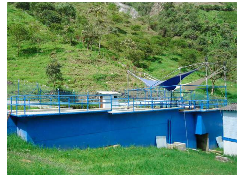
Plantas de tratamiento de aguas potable en San Andrés de Cuerquia (1)