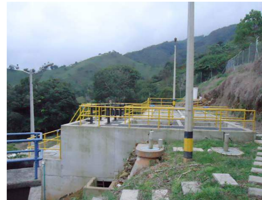
Plantas de tratamiento de aguas potable en Briceño (2)

Con recursos de la Hidroeléctrica Ituango, EPM contrató los diseños de obras de acueducto y alcantarillado en 8 municipios de su zona influencia, como aporte adicional a los dineros del Plan Integral Hidroeléctrica Ituango. Esta labor será realizada por la firma Consorcio Generación Ituango (Integral – Solingral), que garantiza una alta calidad técnica para el posterior desarrollo de las obras que se van a construir. Este aporte de la Hidroeléctrica tendrá un valor de $ 2.100 millones de pesos. El contrato tiene una duración de 6 meses.