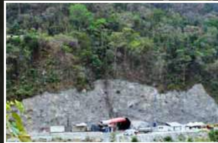
Galería 3 Aguas abajo