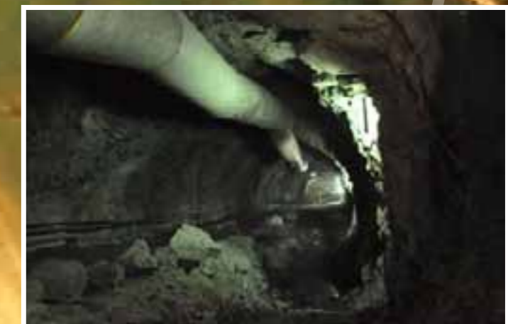
Túnel desviación izquierdo