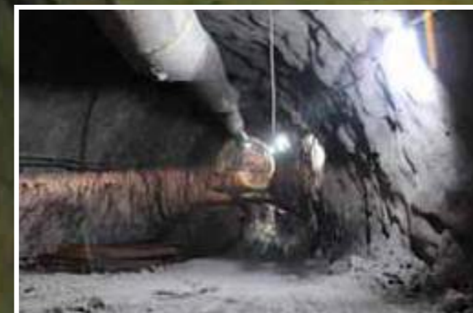
Túnel desviación derecho