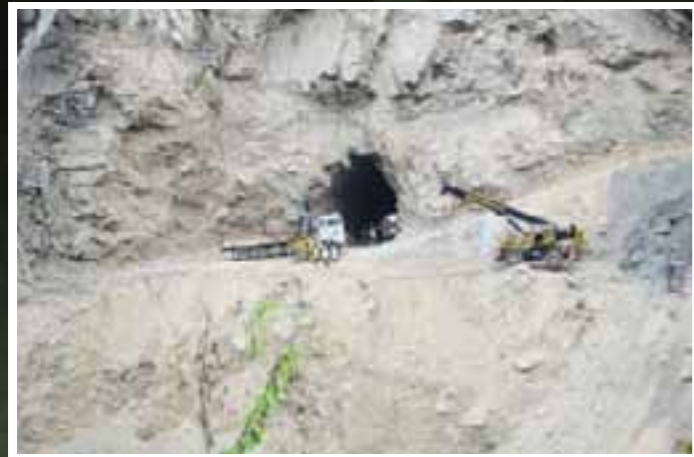
Galería 2 Pozos de compuertas