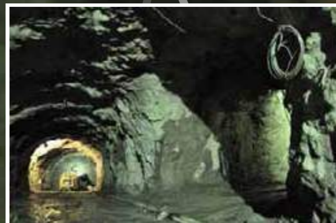
Túneles acceso a Casa de Máquinas