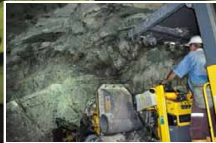
Perforación para voladura en el acceso a Casa de Máquinas