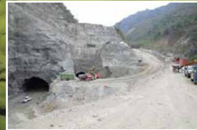
Portales de salida del túnel de desviación izquierdo y derecho