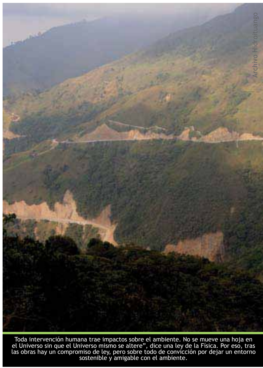
Toda intervención humana trae impactos sobre el ambiente. No se mueve una hoja en el Universo sin que el Universo mismo se altere”, dice una ley de la Física. Por eso, tras las obras hay un compromiso de ley, pero sobre todo de convicción por dejar un entorno sostenible y amigable con el ambiente.

para su construcción, tendremos especial cuidado en la implementación de las medidas del Plan de Manejo Ambiental y, especialmente, en las relaciones armónicas y de confianza con la comunidad impactada, las autoridades locales y todos los grupos de interés involucrados, por medio de procesos de información, consulta y concertación.