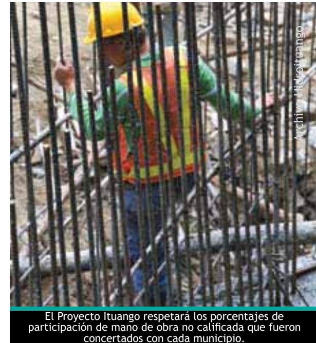
El Proyecto Ituango respetará los porcentajes de participación de mano de obra no calificada que fueron concertados con cada municipio.