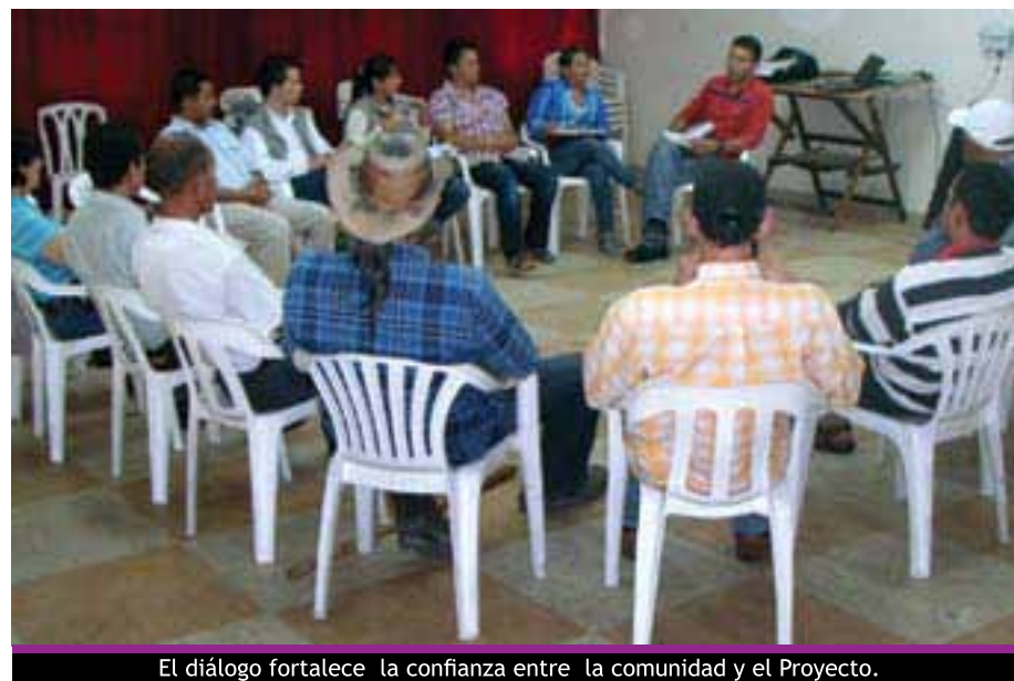
El diálogo fortalece la confianza entre la comunidad y el Proyecto.

La invitación es a que participemos y a que estemos atentos. De una forma muy afectuosa, le pido a toda la comunidad que nos apropiemos de este proyecto, que lo hagamos nuestro, que empecemos a quererlo desde ya y que estemos muy vigilantes para que sea el polo de desarrollo para nuestra comunidad. ●