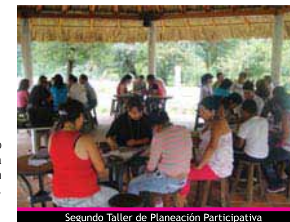
Segundo Taller de Planeación Participativa

“Me pareció excelente este segundo taller... hubo mayor participación, enriquecimos la visión