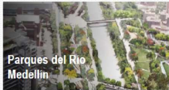
Parques del Río Medellín