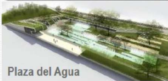
Plaza del Agua