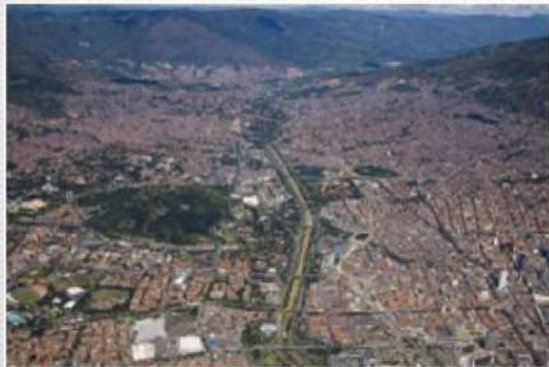
Plan de Saneamiento

Convenio Marco de Cooperación Interinstitucional “Nuestro Río” Unificar criterios y lineamientos de planificación y ejecución que conlleven a la recuperación, calidad y conservación del Río Medellín-Aburrá y sus afluentes.