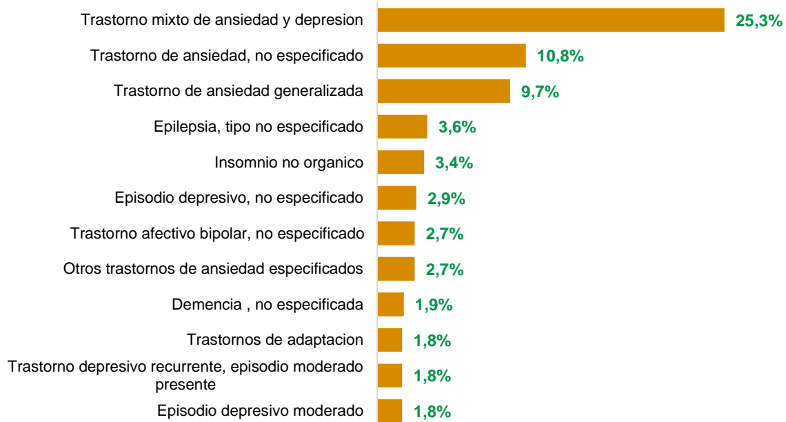
Gráfico 2. Diez principales diagnósticos relacionados con salud mental. Unidad Servicio Médico EPM, junio 2023.