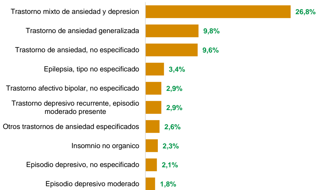
Gráfico 2. Diez principales diagnósticos relacionados con salud mental. Unidad Servicio Médico EPM, marzo 2023.