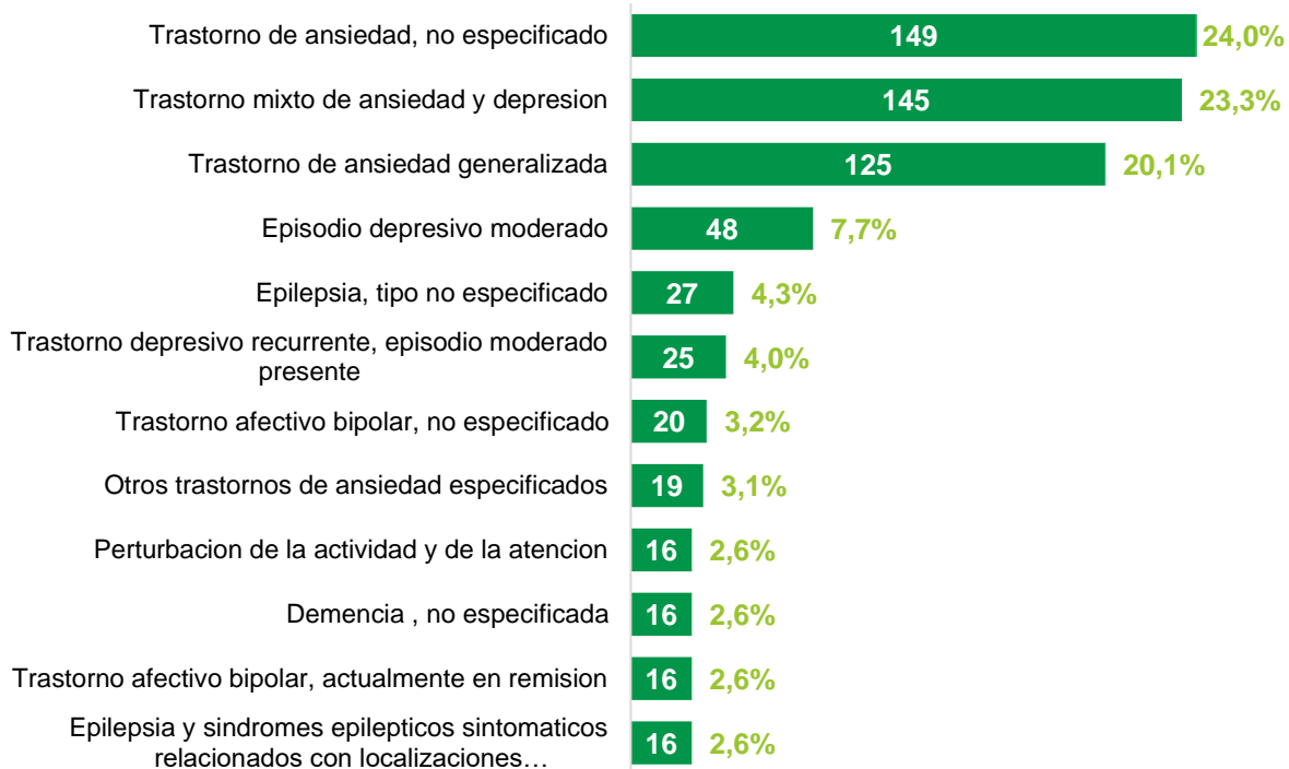
Gráfico 2. Diez principales diagnósticos relacionados con salud mental. Unidad Servicio Médico EPM – 2021.