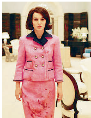
Este biopic de Pablo Larrain narra los días posteriores al asesinato de John F. Kennedy.