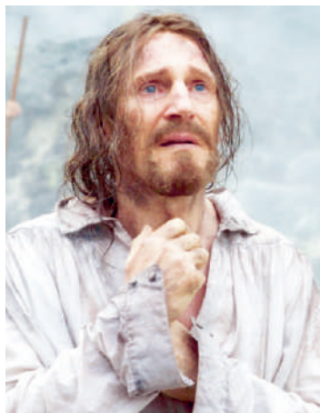
Martin Scorsese dirige esta película en la que varios jóvenes pondrán a prueba su fe.