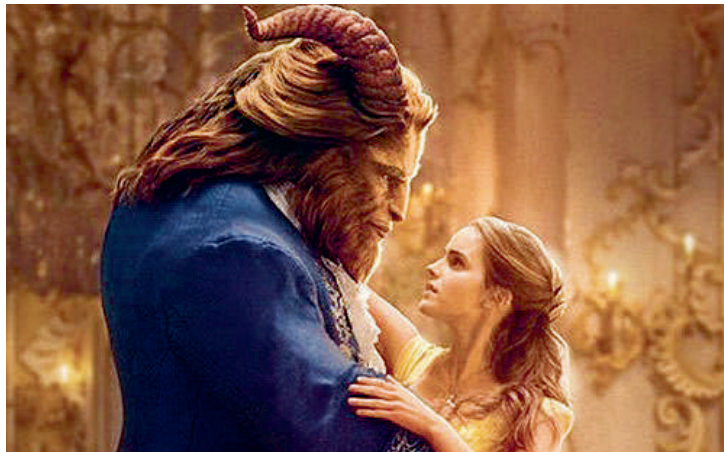
Dos cintas que llegaron esta semana: La Bella y la Bestia y Silencio. Jackie (der) se estrenó la semana pasada. FOTOS PELÍCULAS.

Los estrenos iniciaron con hadas esta semana. La anterior se habían sumado Jacki y Logan, que siguen en cartelera ■