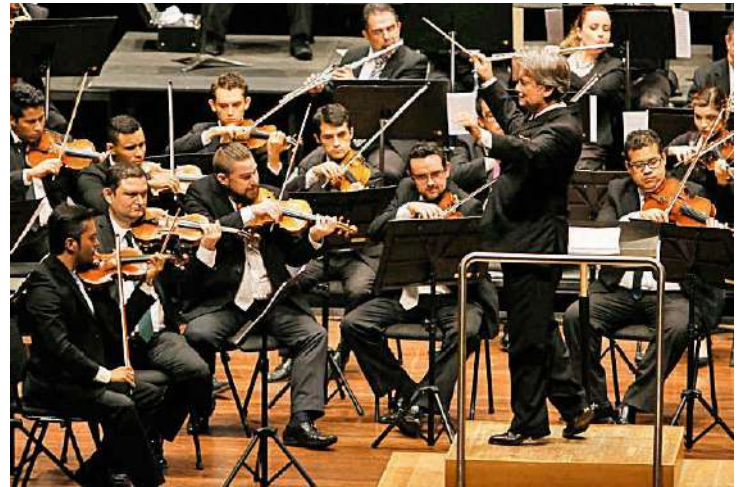
En un hecho inédito se unen Filarmónica y Sinfónica de Antioquia. La primera ya lo hizo con Eafit y la Academia.

Por eso están felices, dicen: la primera vez juntos, tantos en el escenario.