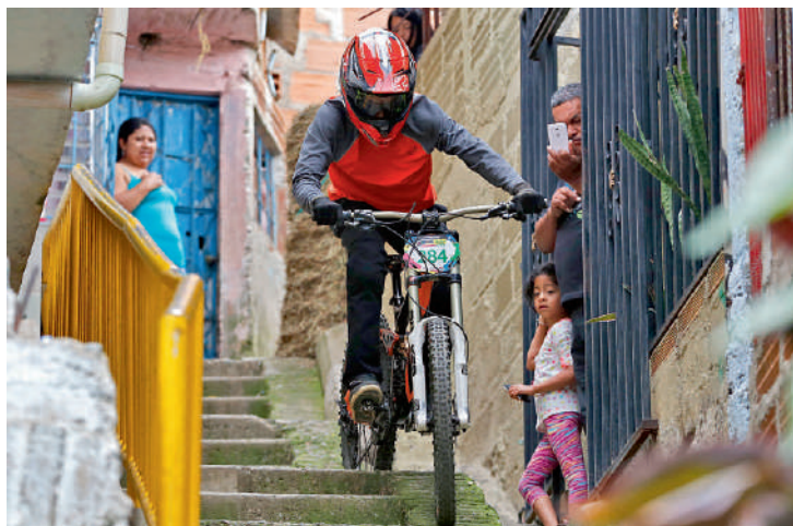
El downhill será uno de los eventos que llevará emoción a la Comuna 7 gracias a Adrenalina Urban Bike.

El plato atractivo correrá por cuenta del downhill urbano. En esta modalidad de descenso, los intrépidos pilotos, pasando por escaleras, adoquines y espacios reducidos, cruzarán por el parque de la Biblioteca Tomás Carrasquilla. Luego seguirán bajando para encontrarse con la pista de trote, patinaje y la cancha sin-