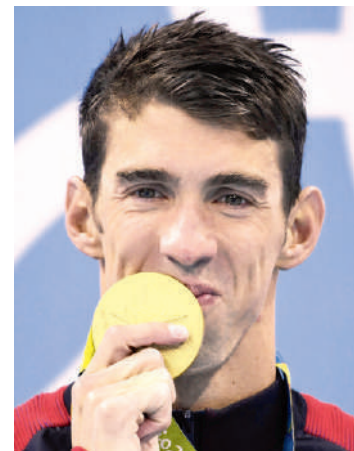
Esta imagen de Phelps es recurrente en las últimas ediciones de las justas.

La victoria de Phelps en los 200 metros lo convirtió tam-