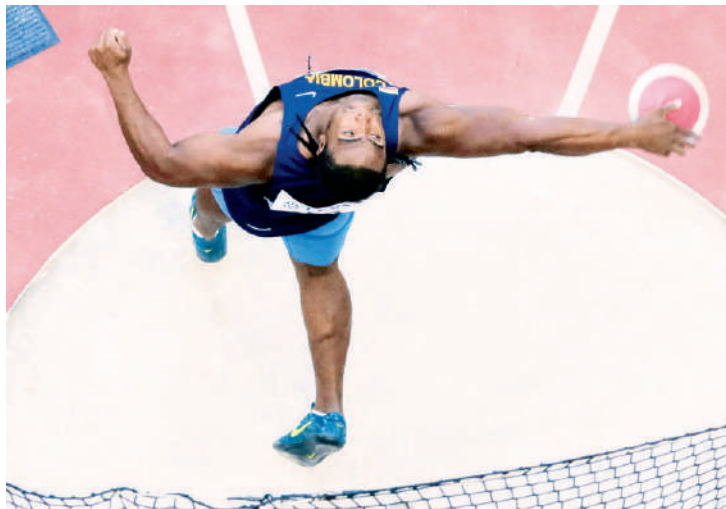
"Así es el deporte, a veces te alegra, a veces no. Hay que seguir adelante", expresó Ortega, al margen ayer en Rio.

Ayer el deportista no pudo repetir lo que venía haciendo y quedó eliminado en la ronda clasificatoria de los juegos.