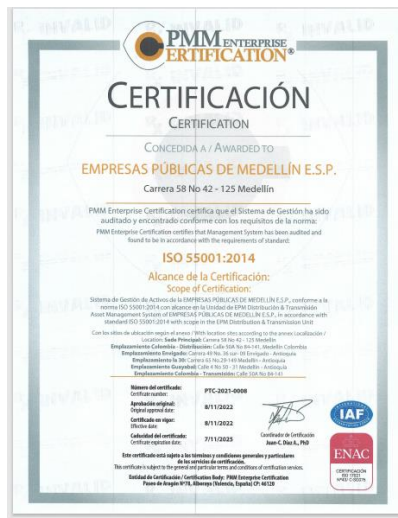
Gráfico 1. Certificado del Sistema de Gestión de Activos otorgado a EPM por PMM Enterprise Certification

El sistema de Gestión de Activos de las unidades de negocio de Transmisión y Distribución de EPM fue certificado el 8 de noviembre de 2022 y con vigencia hasta 7 de noviembre de 2025, lo que evidencia que el sistema de gestión de activos es adecuado, pertinente y eficaz-